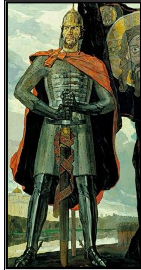
П.Д. Корин Александр Невский