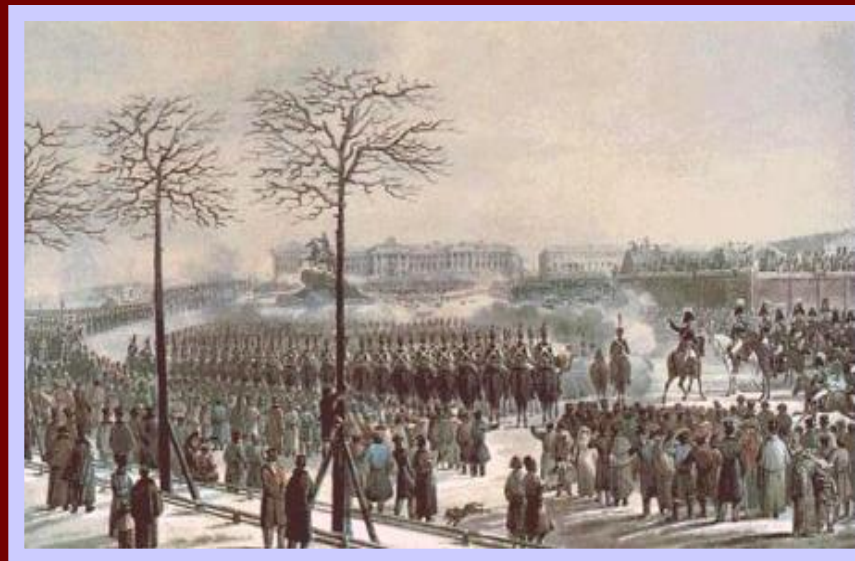
Восстание 14 декабря 1825 г. на Сенатской площади.