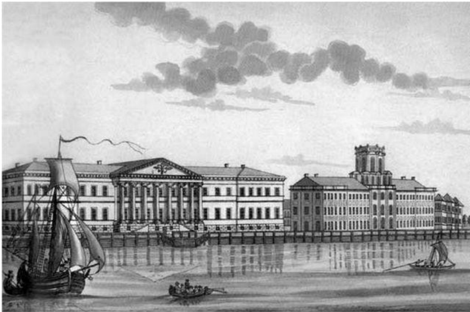
Здание Академии наук