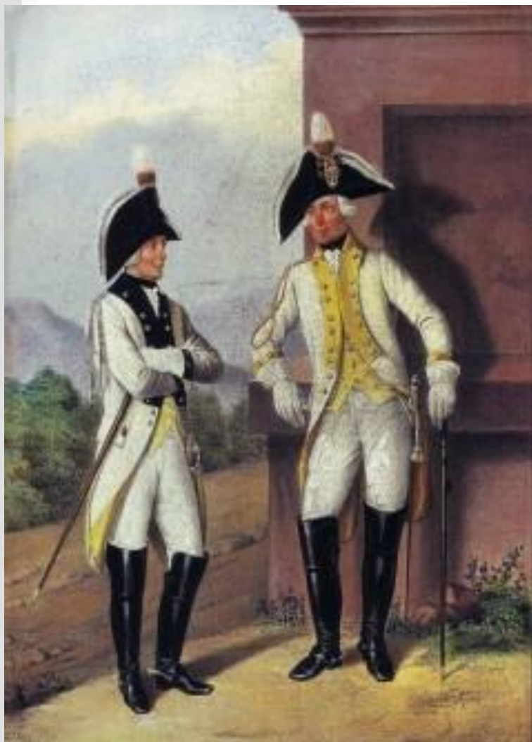
Генералы Харьковского и Малороссийского полка в виц-мундирах.