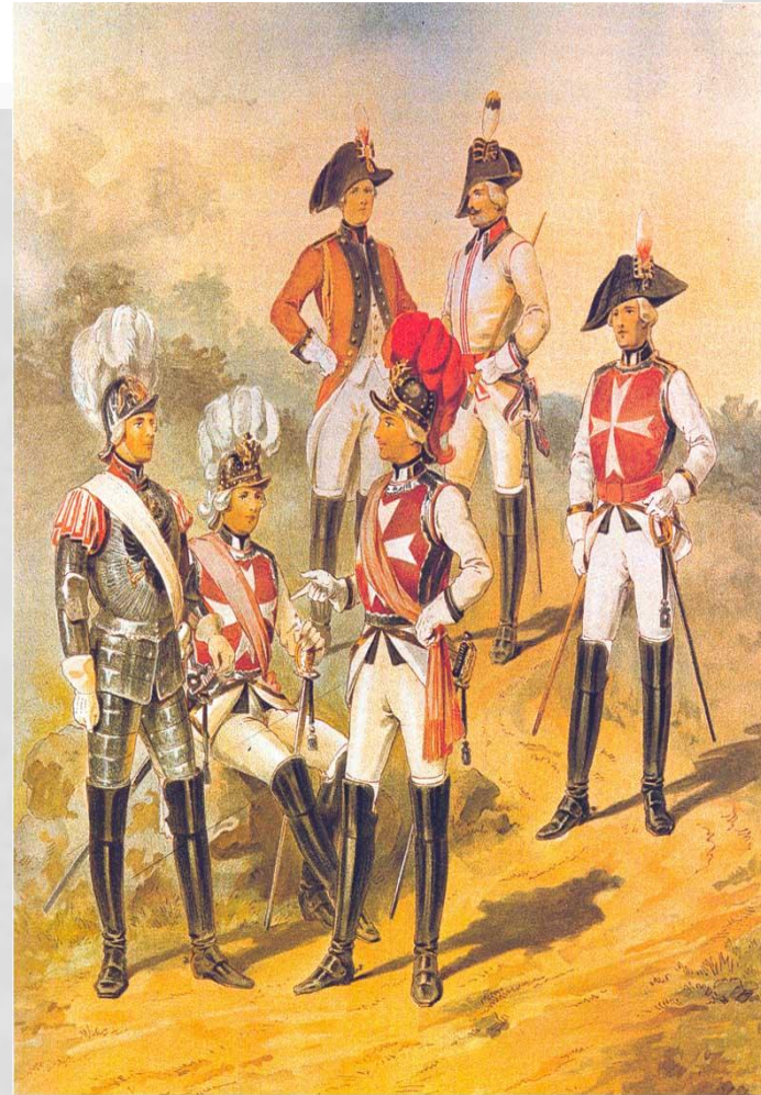
Кавалергарды в царствование Павла I