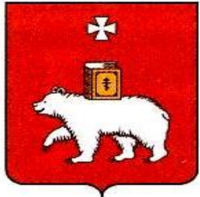
Новый герб города Перми

Сравните гербы, найдите общее, особенное и попробуйте объяснить.