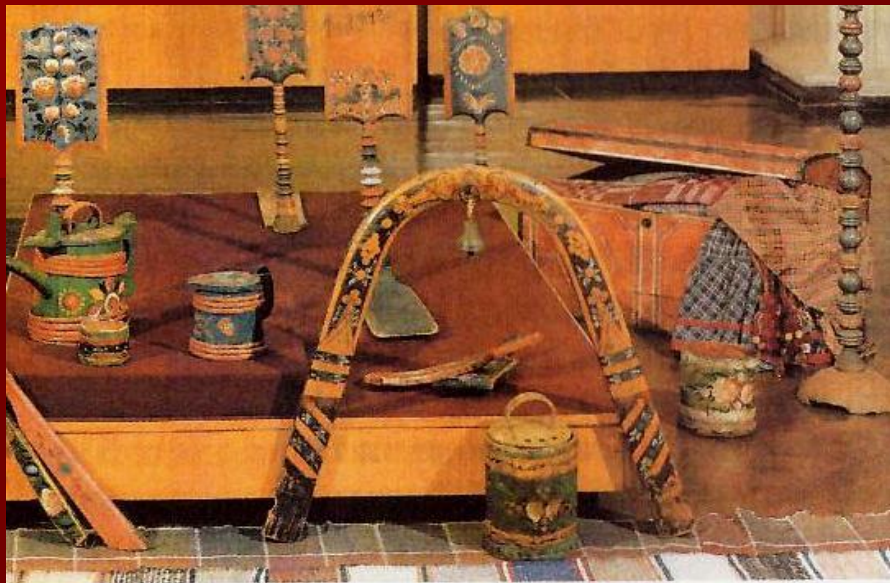
Расписные предметы крестьянского быта из дерева и бересты