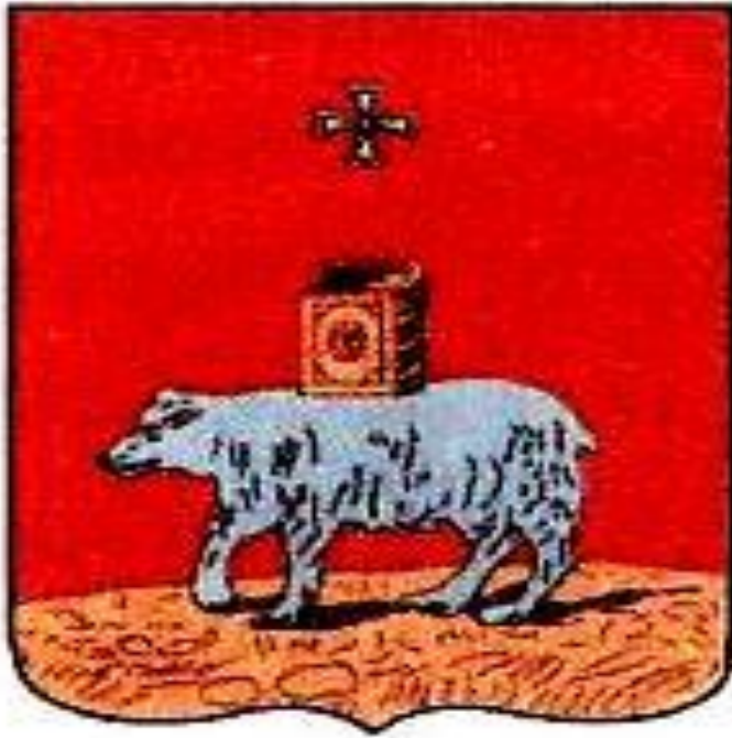
Старый герб города Перми