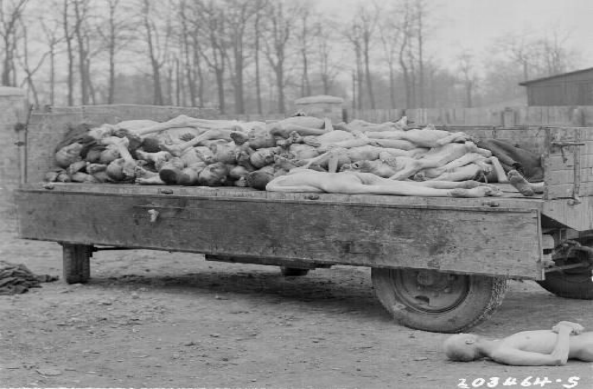
Концентрационный лагерь "Бухенвальд"