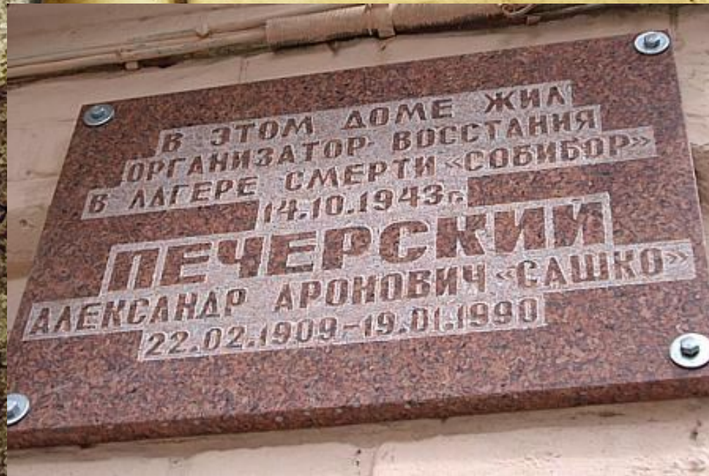
Мемориальная доска на доме, где жил Печёрский