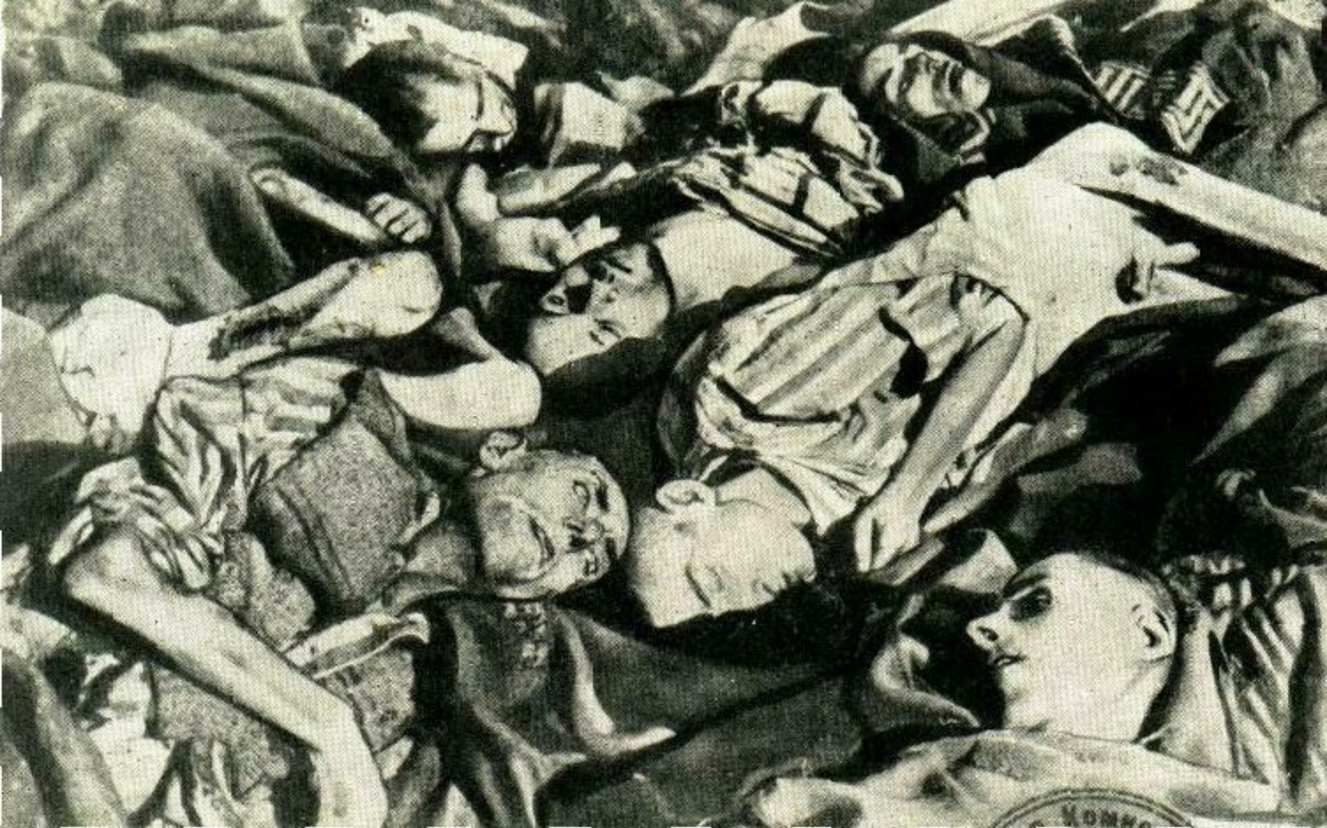
Концентрационный лагерь «Освенцим»