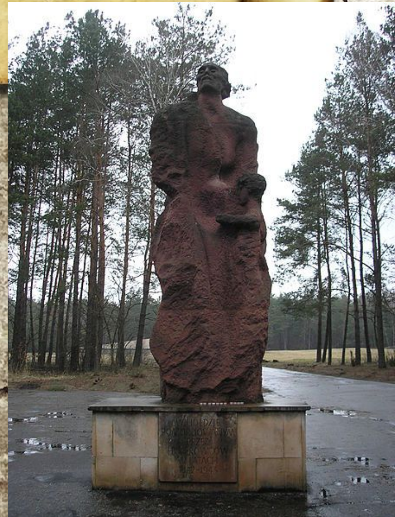
Монумент в Собиборе