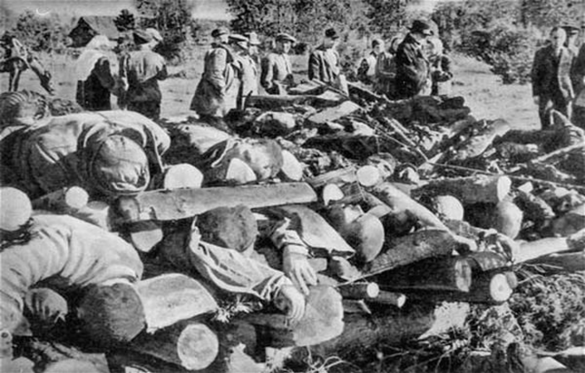
Концентрационный лагерь "Майданек"