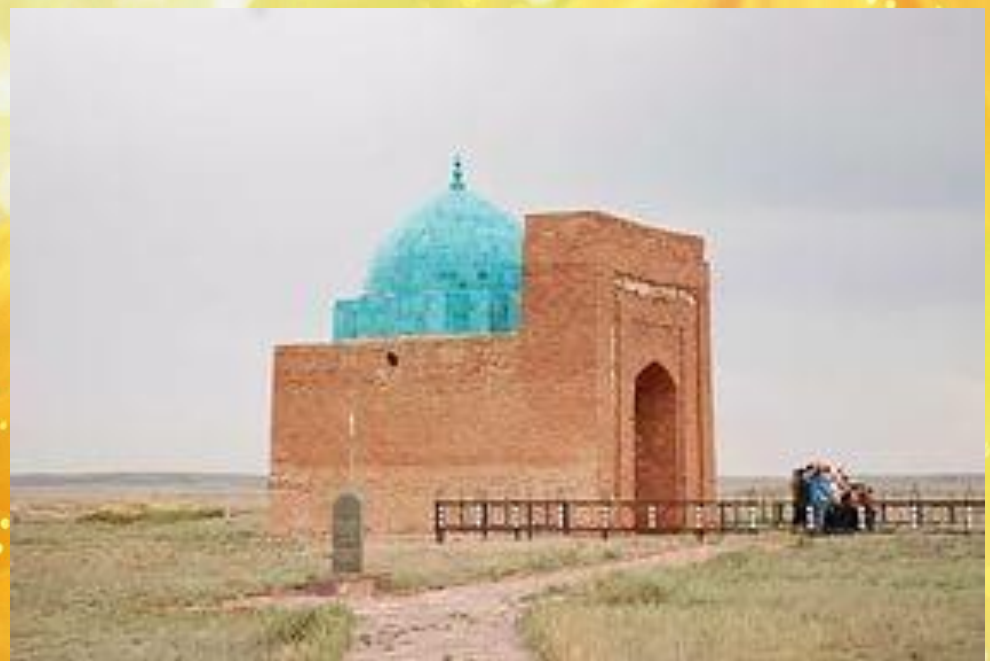
Жошы хан мазары, Жезқазған қаласы, Кеңгір өзенінің маңы (1187-1227ж)

Оның құрған хандығы Алтын орда деп атаған. Ол өлгеннен кейін Алтын орда ұсақ ұлыстарға бөлініп кетеді де Ақ Орда ұлысын Жошыханның баласы Орда Ежен басқарады