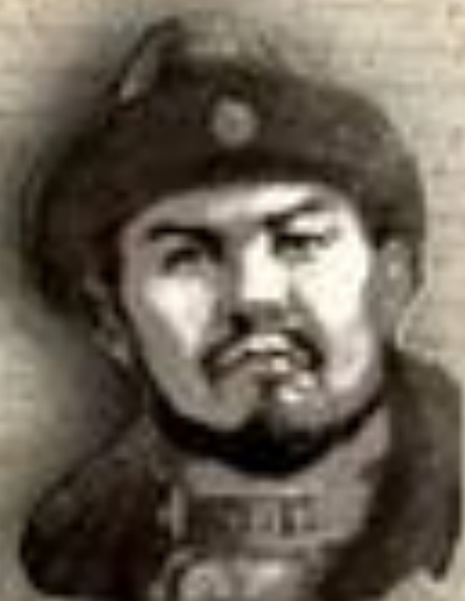
(1445–1518) «ҚАСҚА ЖОЛЫ» (СВЕТЛЫЙ ПУТЬ) ҚАСЫМ ХАН