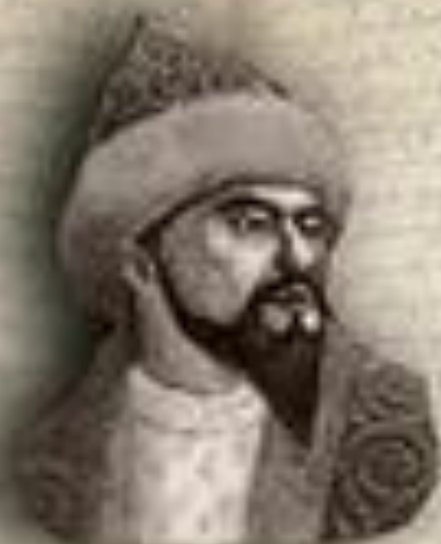
(1598 — 1628) «ЕСКІ ЖОЛЫ» (ДРЕВНИЙ ПУТЬ) ЕСІМ ХАН