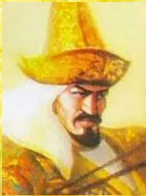
Шыңғысханның үлкен ұлы Жошы хан (1187-1227ж)

Ертістен Еділге дейінгі болған жерлер тиеді. Оны Дешті-Қыпшақ даласы деп атаған.