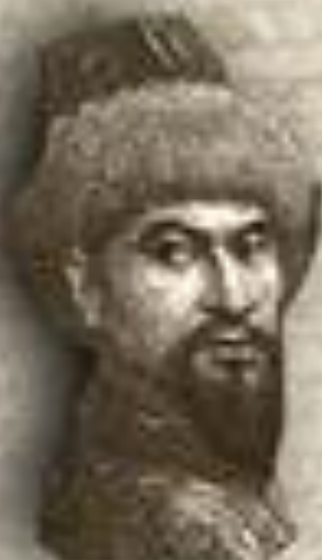
(1626–1718) «ЖЕТІ ЖАРҒЫ» (СЕМЬ ЗАКОНОВ) ТӘУКЕ ХАН