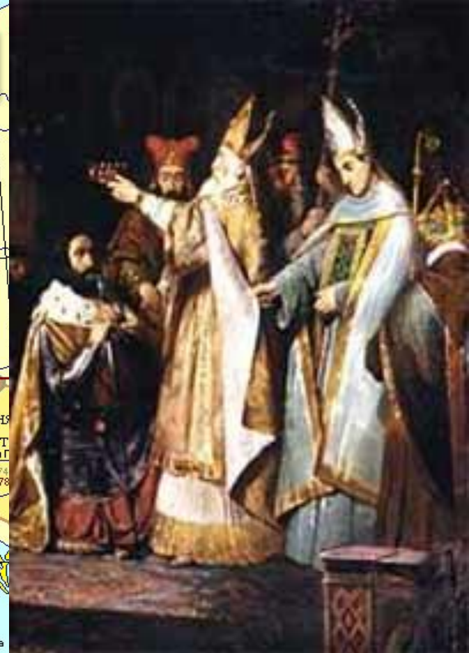
774 г. – Коронация Карла на королевство лангобардов