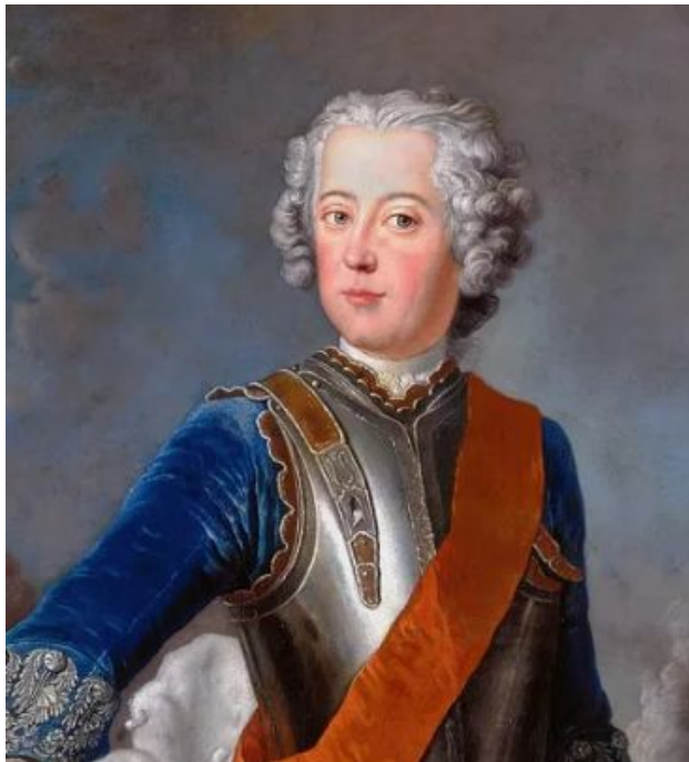
Фридрих II. Потрет

Задание 2: Прочитайте п. 5. Почему Фридрих II с большой надеждой воспринял свадьбу наследника российского престола Петра Федоровича и принцессы Софьи Ангальт-Цербстской? Ответ запишите в тетради.