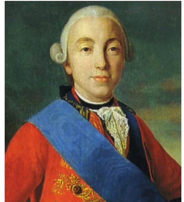
Петр III. Потрет