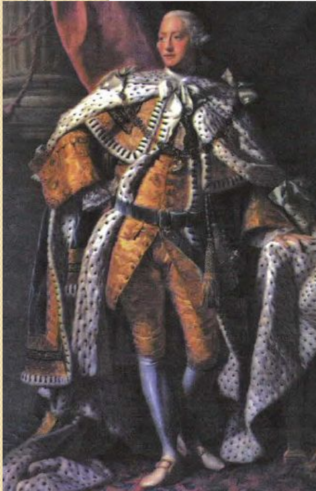
Георг III. Портрет