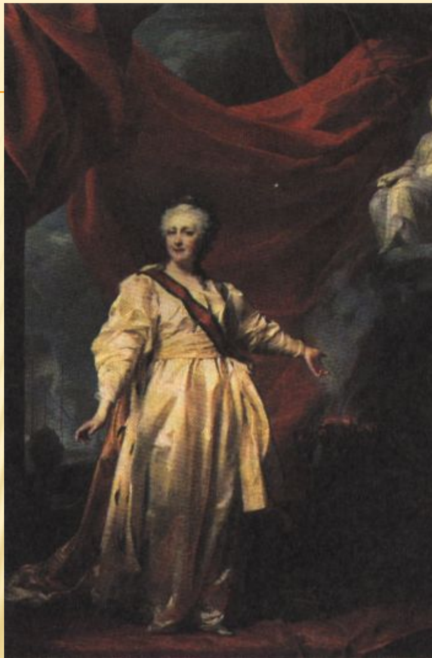
Екатерина II 1762-1796гг.