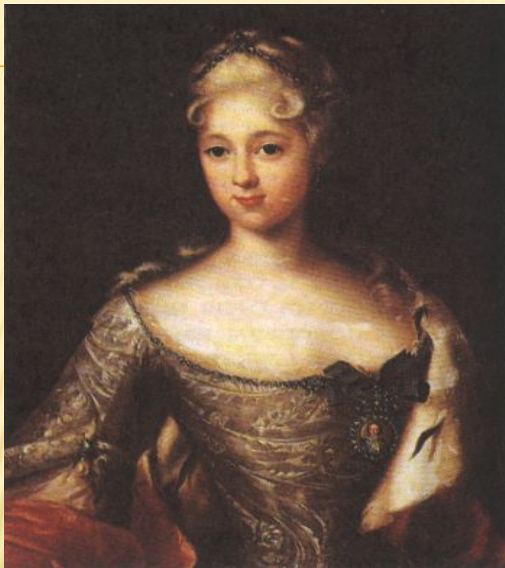
Елизавета Петровна 1741-1761 гг.