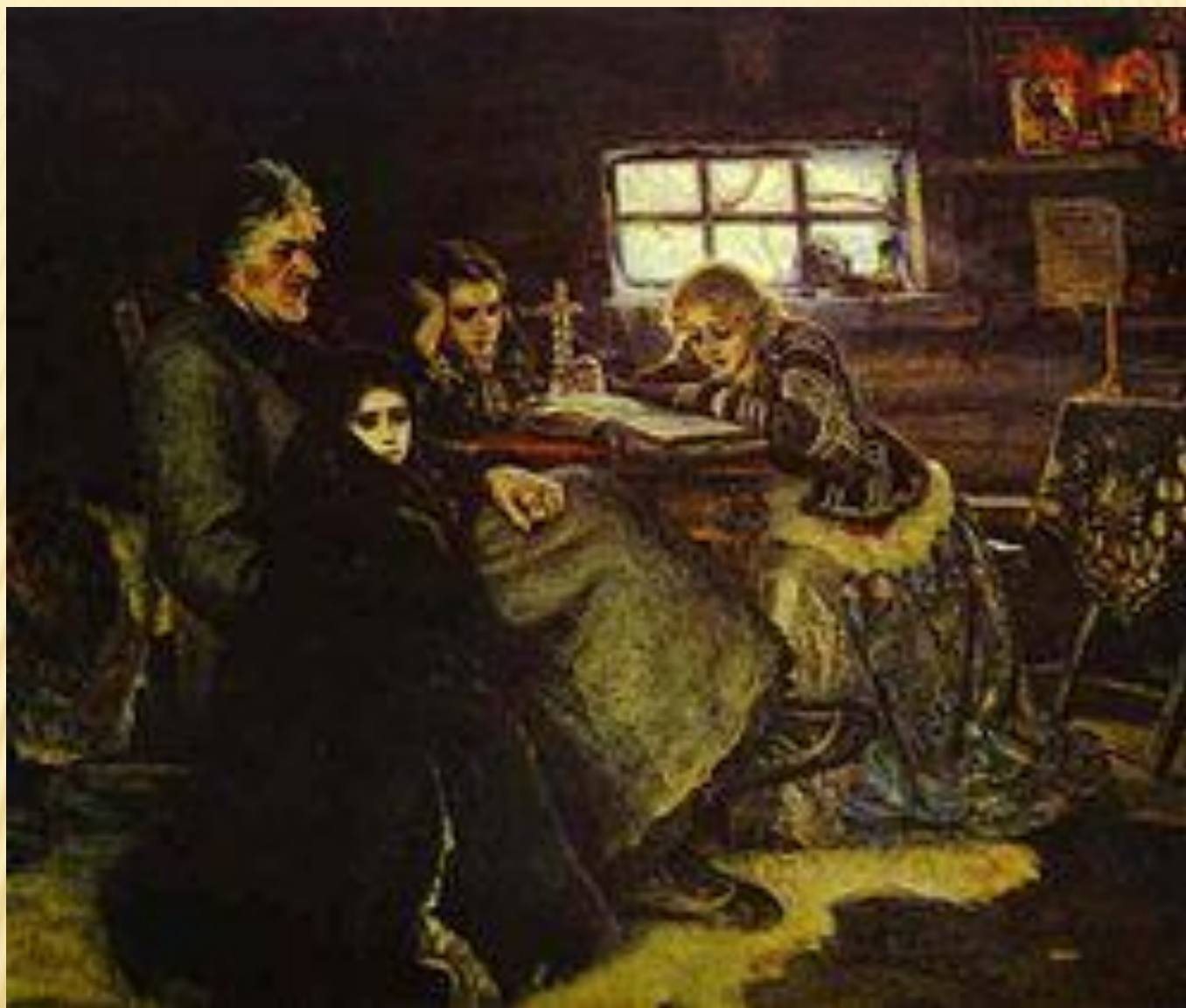
Суриков «Меншиков в Березове»