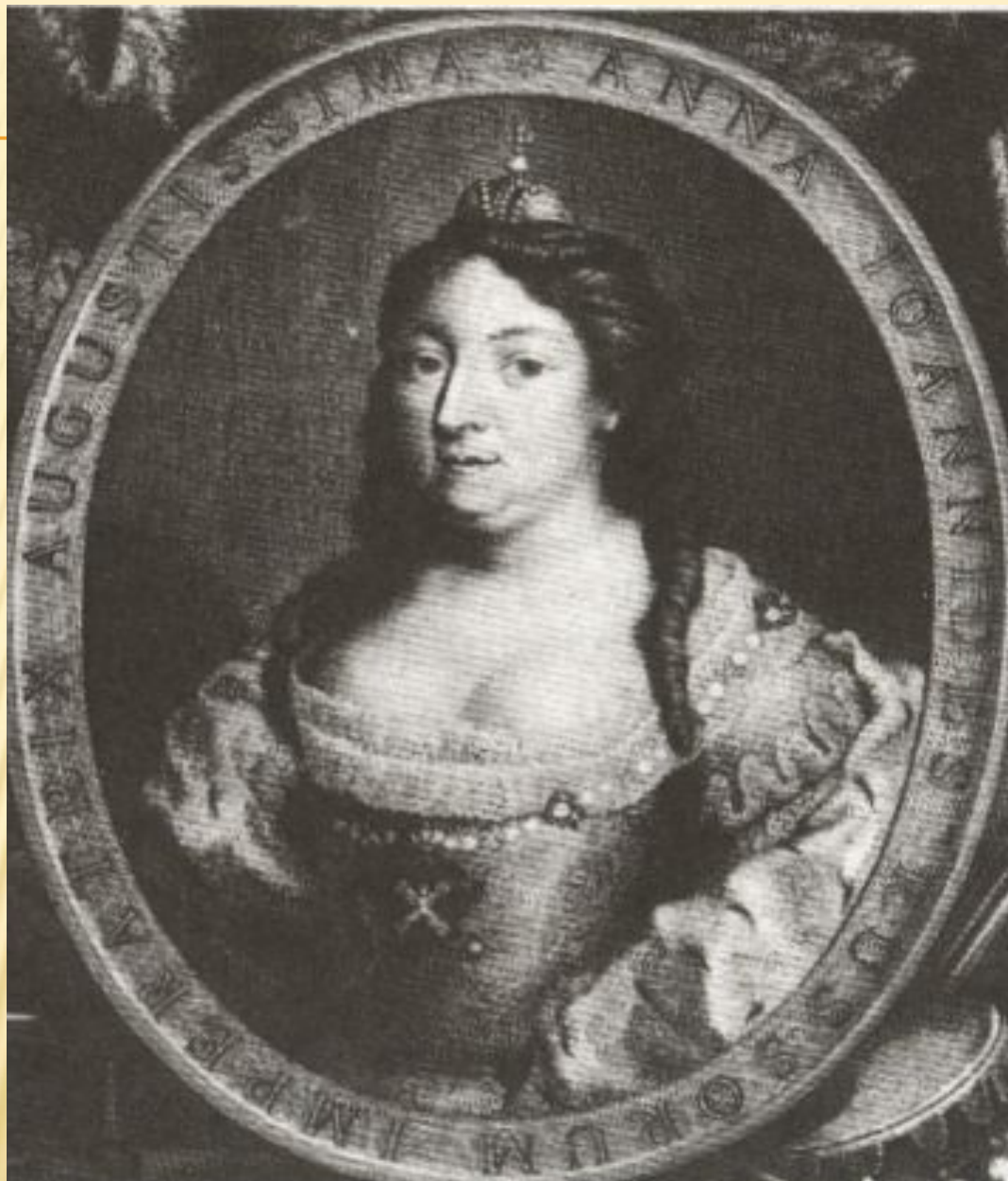
Анна Иоанновна (1730-1740 гг.)