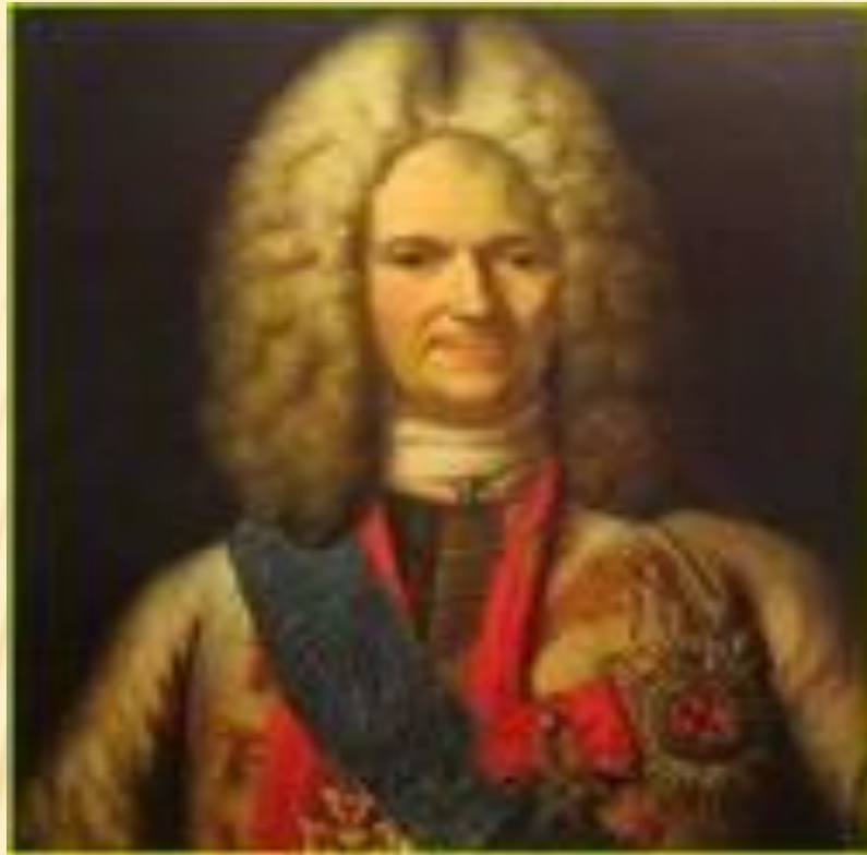
А.Д.Меншиков. Около 1670-1729 гг.