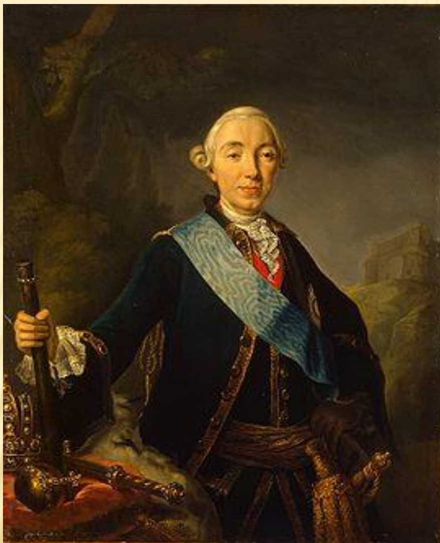
Петр III 1761-1762 гг.