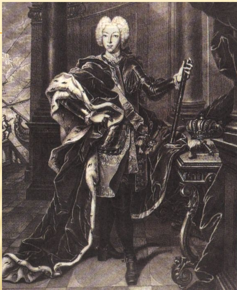
Петр II (1727-1730 гг.)