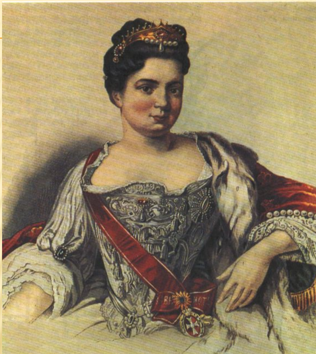
Екатерина I (1725-1727гг.)