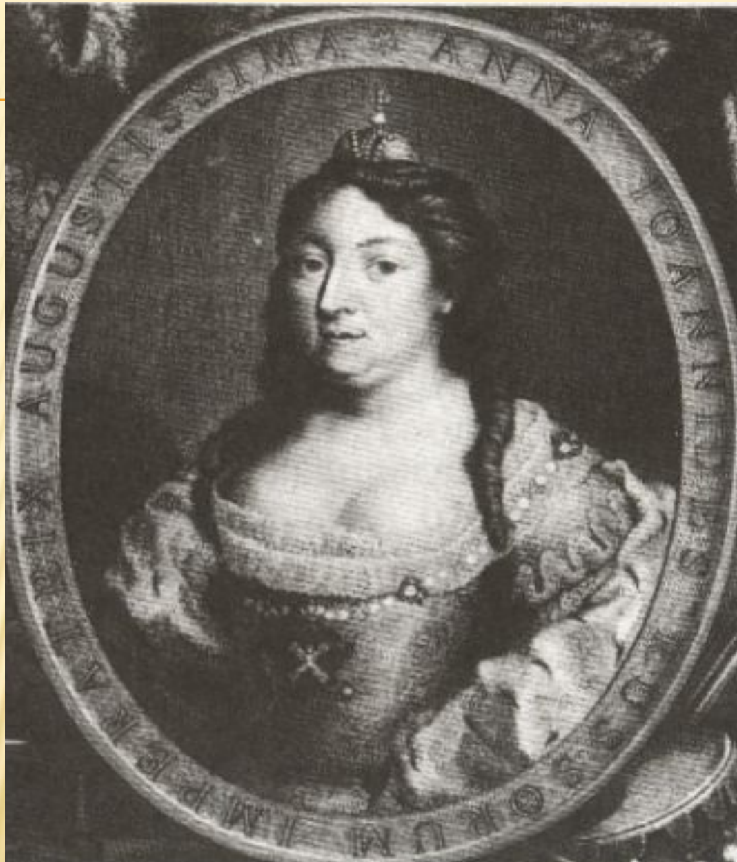
Анна Иоанновна (1730-1740 гг.)