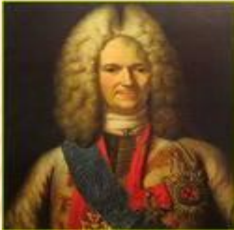
А.Д.Меншиков. Около 1670-1729 гг.