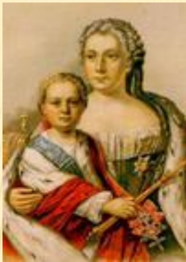
Иван Антонович (1740-1741 гг.) и Анна Иоанновна