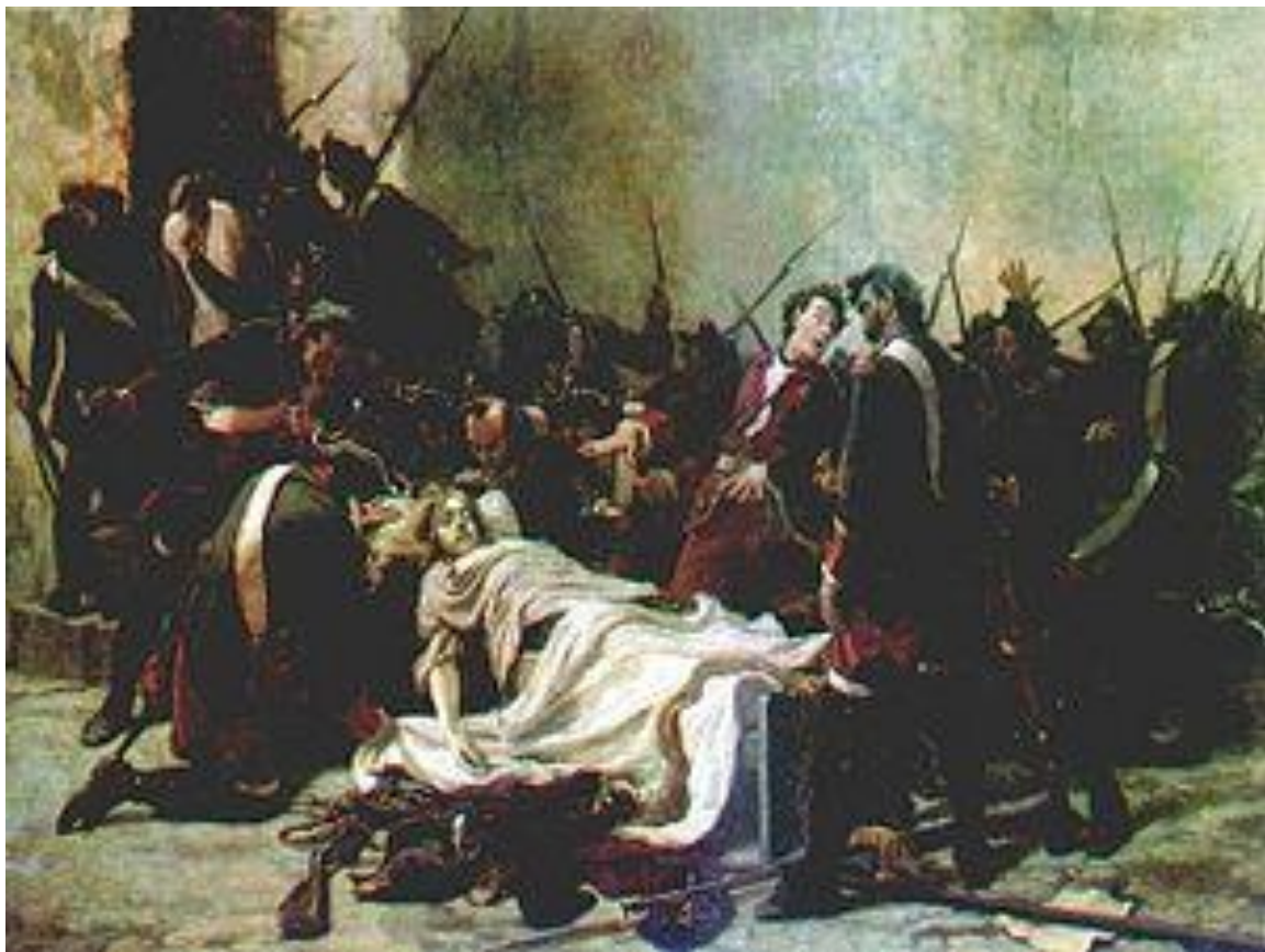
Мирович перед телом Ивана VI. Картина И. Творожникова (1884)