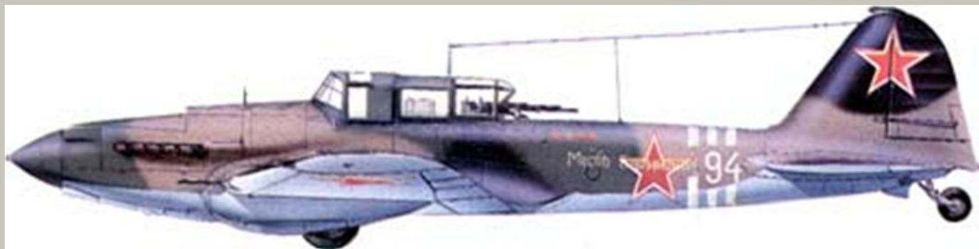
Ил-2М из 943 шап