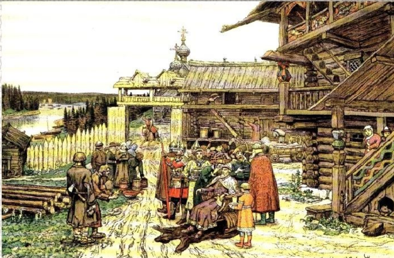
Подворье удельного князя. Васнецов А. М.

Следствие по любому делу велось очень тщательно: вызывались свидетели, выслушивались стороны, и только тогда суд выносил решение. Если свидетелей не было и дело было неясным, обвиняемых подвергали испытанию железом или водой.