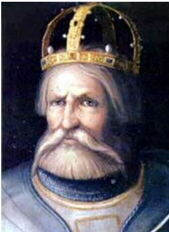
Фридрих I Барбаросса