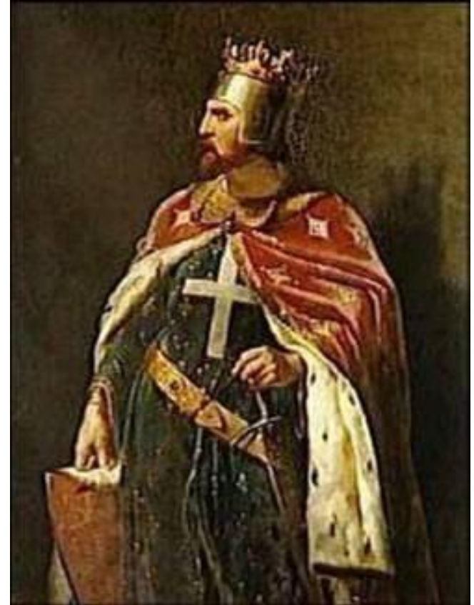
Ричард I Львиное Сердце