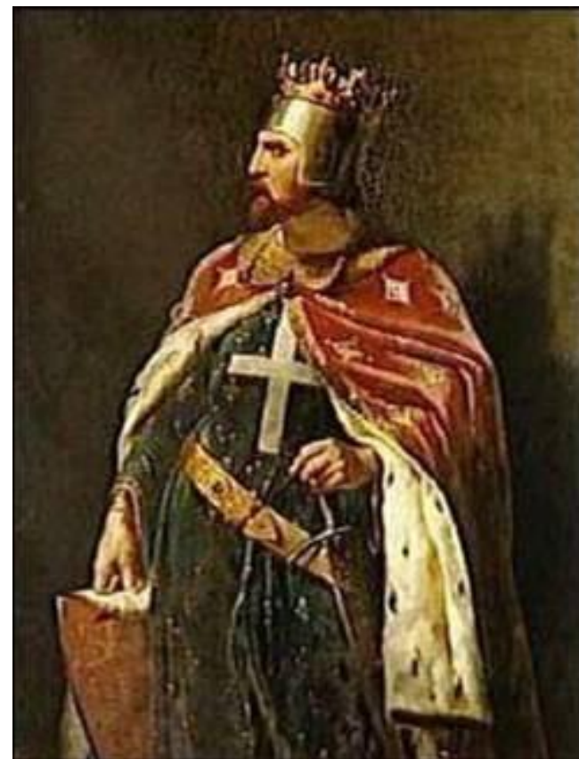
Ричард I Львиное Сердце