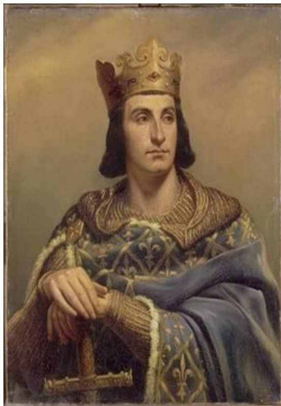
Филипп II Август