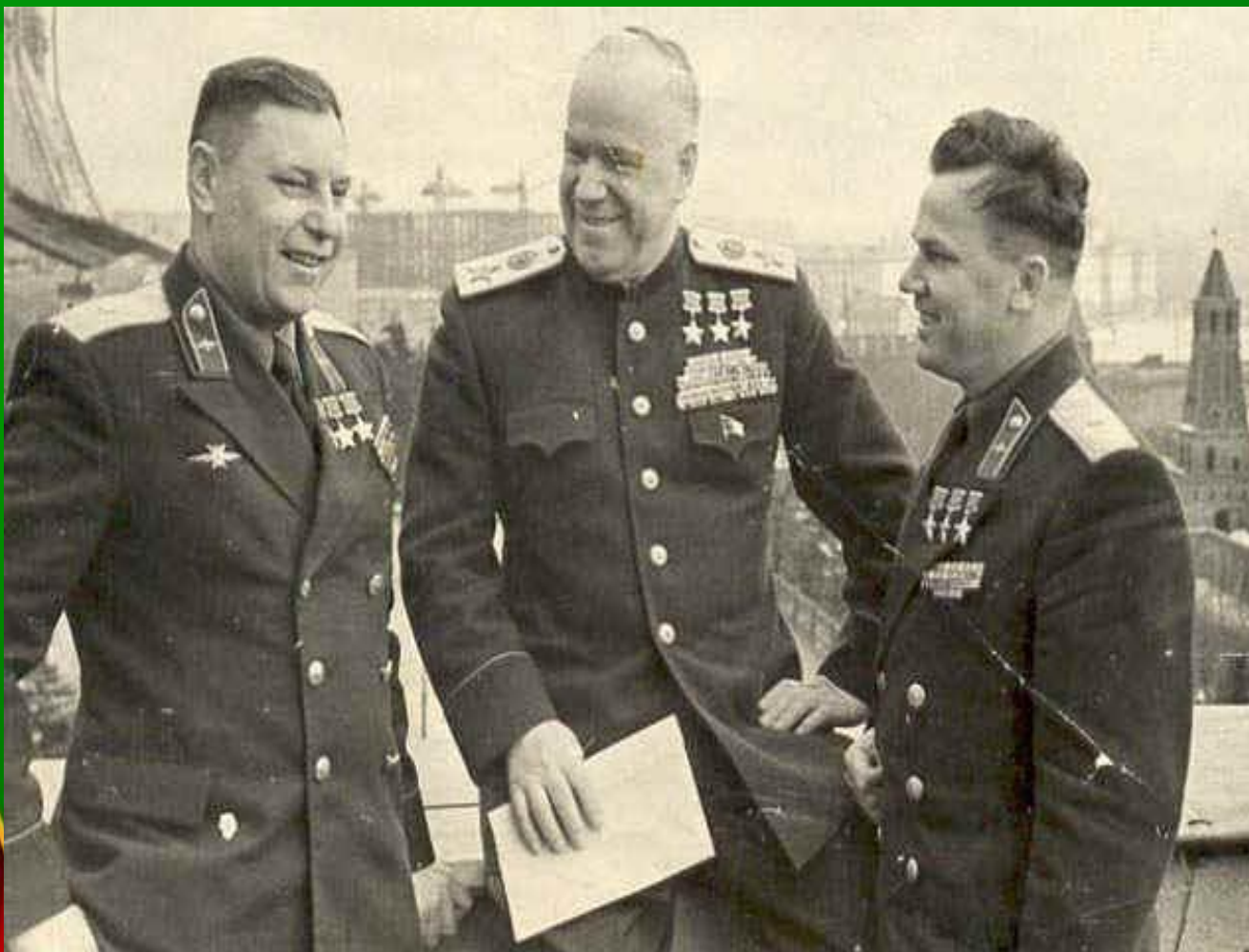
Трижды Герои Советского Союза (слева направо) генерал-майор авиации Покрышкин А.И., и генерал-майор авиации Кожедуб И.Н. В центре четырежды герой Маршал Советского Союза Жуков Г.К. во время встречи в Москве.