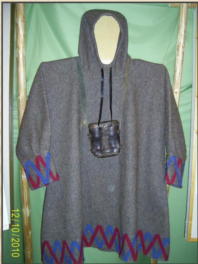
«НОЙ ПАРКА» одежда оленеводов, ОХОТНИКОВ

ИРИКМ. Сшита в мастерской «Ижемский оленевод и Ко», с. Сизябск