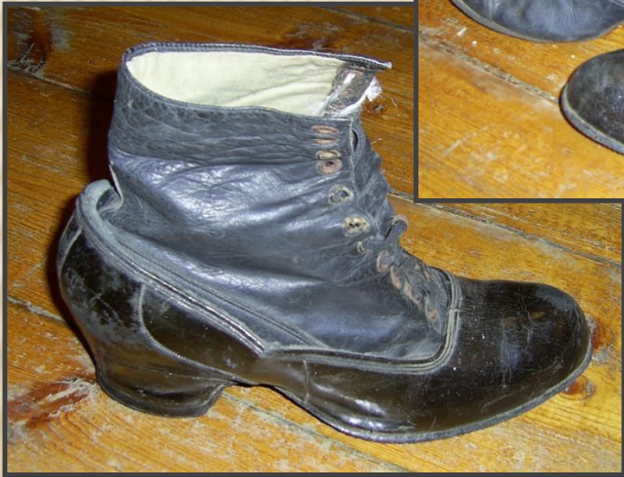
«КОЛОША КАМАШ» (женские ботинки с калошами)