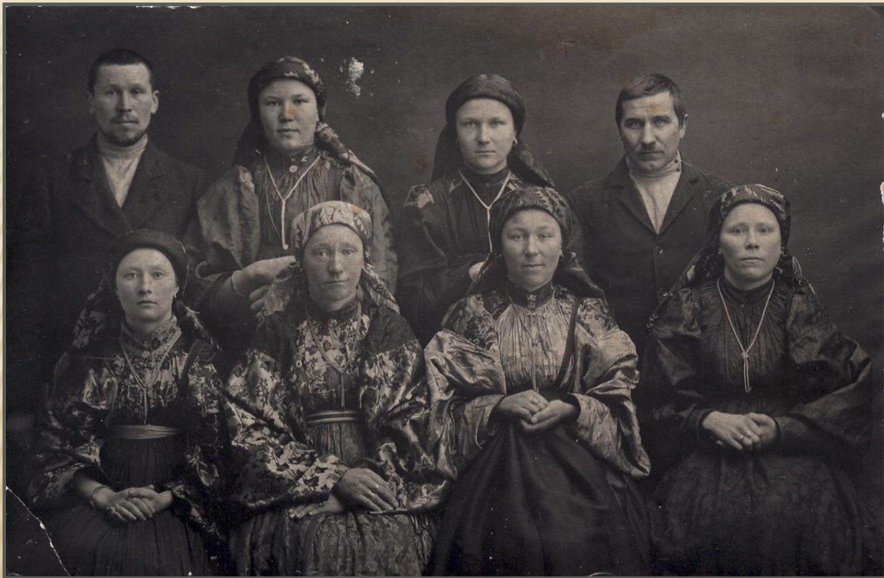
Жители с. Ижма, 1930 г.