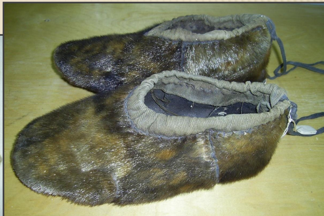
«НЕРПА ЧУРК» (обувь из шкуры нерпы)