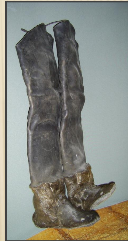
«ГÖЛЯН» рабочая обувь из шкуры нерпы и кожи животных