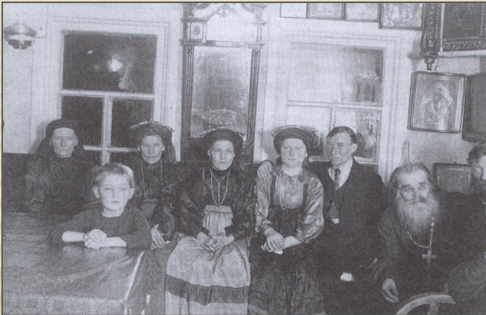
Свадьба в с. Мохча, Ижмо-Печорский уезд Автономной обл. Коми, 1929г.