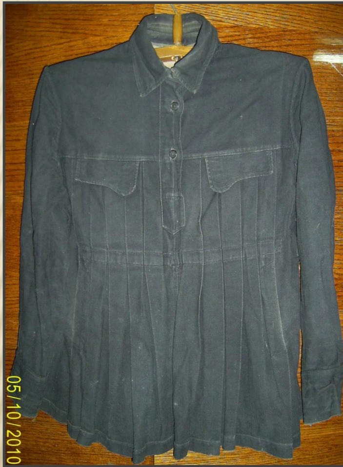
РУБАХА, вторая половина XIX века