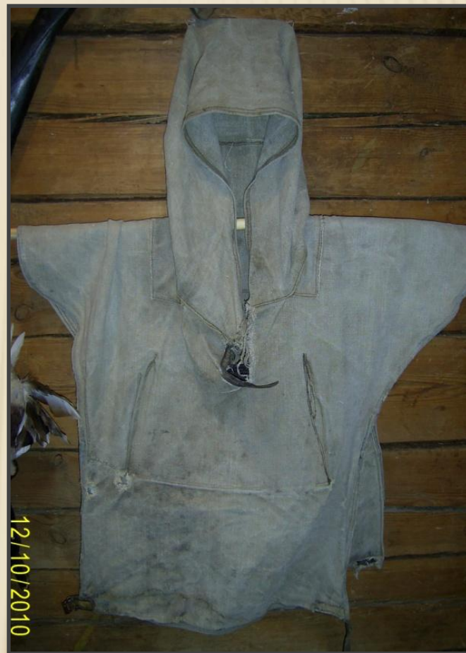
«ЛУЗАН», одежда охотника

ИРИКМ. Сшита в мастерской «Ижемский оленевод и Ко», с. Сизябск