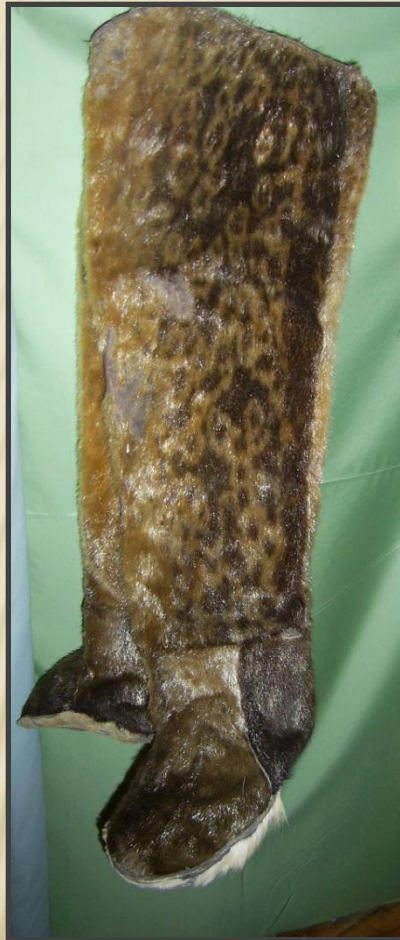
«НЕРПА ГÖЛЯН» рабочая весенне-осенняя обувь из нерпы