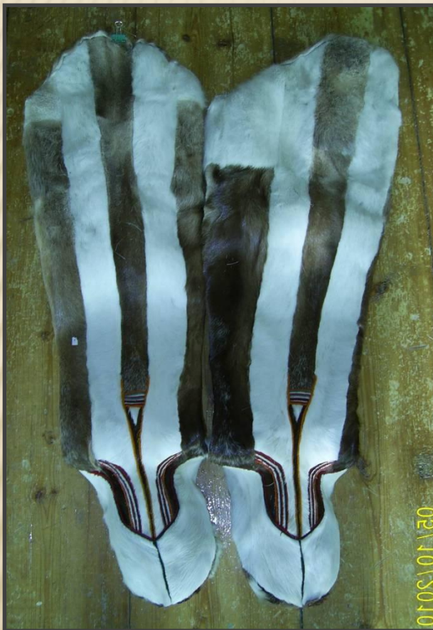
ПИМЫ из оленьего меха с меховой подошвой