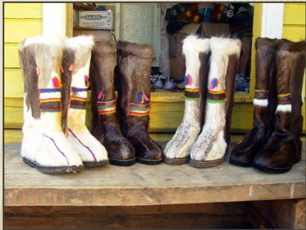
Современные пимы «БУРКА»