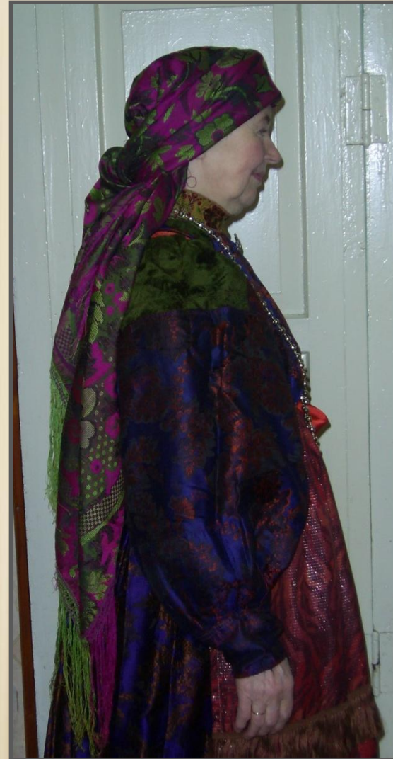
Коми-ижемка в традиционном костюме.