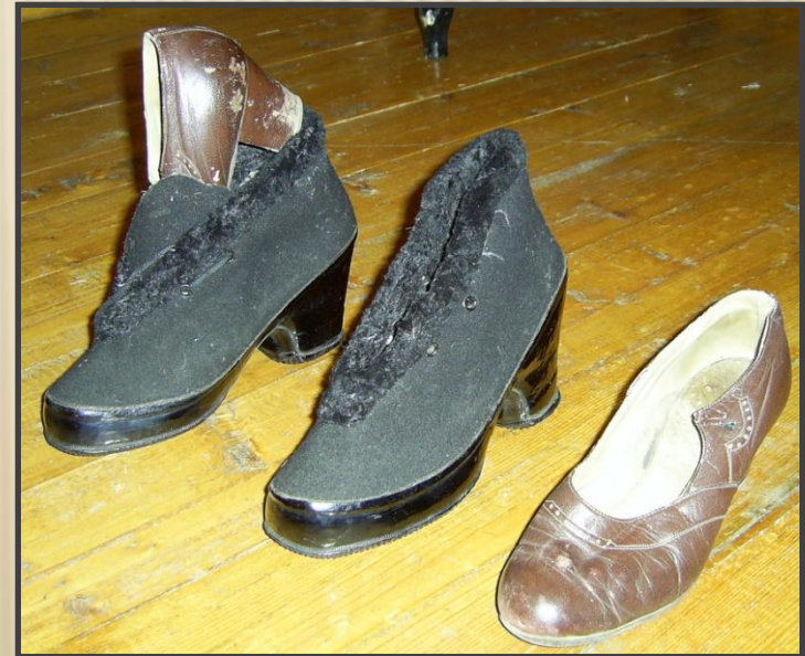
«КАБЛУКА БОТЫ» (туфли с одевающимися на них ботами)