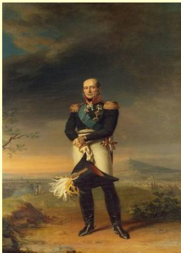
Барклай -де -Толли

1. По свидетельству современников, в момент Бородинской битвы он с ледяным спокойствием оказывался в самых опасных местах, как будто намерено искал смерть. Под ним было убито 5 лошадей, рядом с ним погибли 2 его адъютанта. Кто это был?