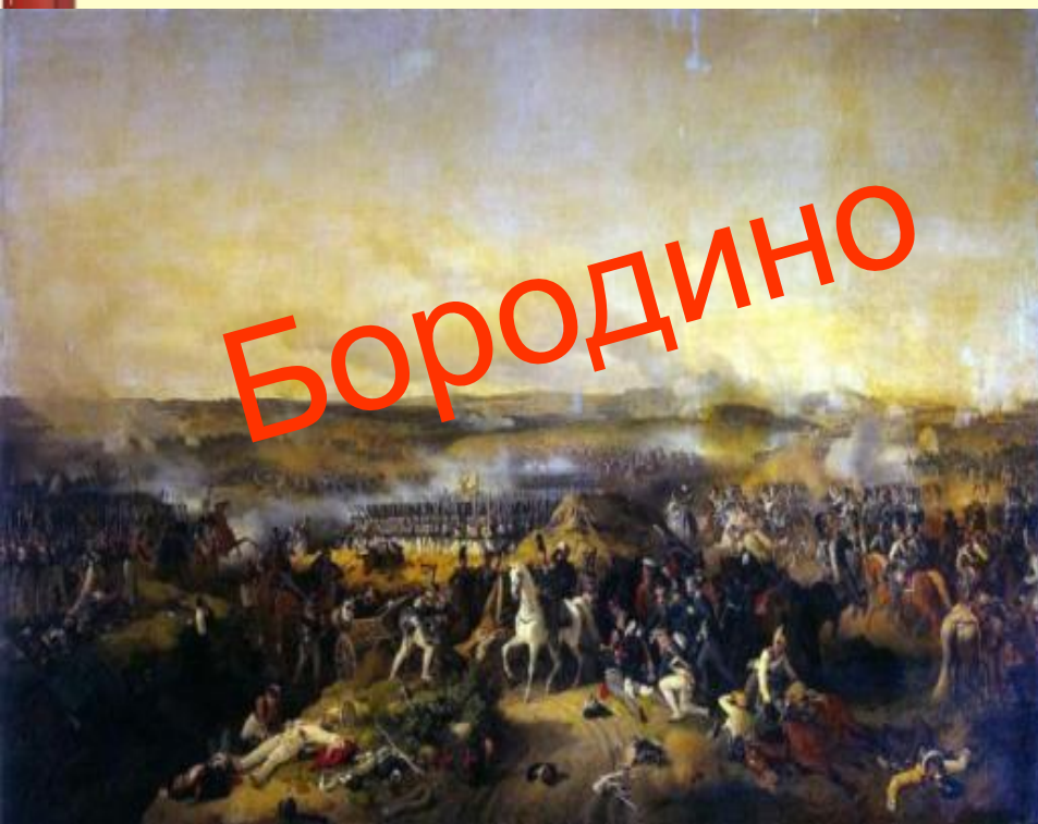
Соотношение сил накануне Бородинского сражения