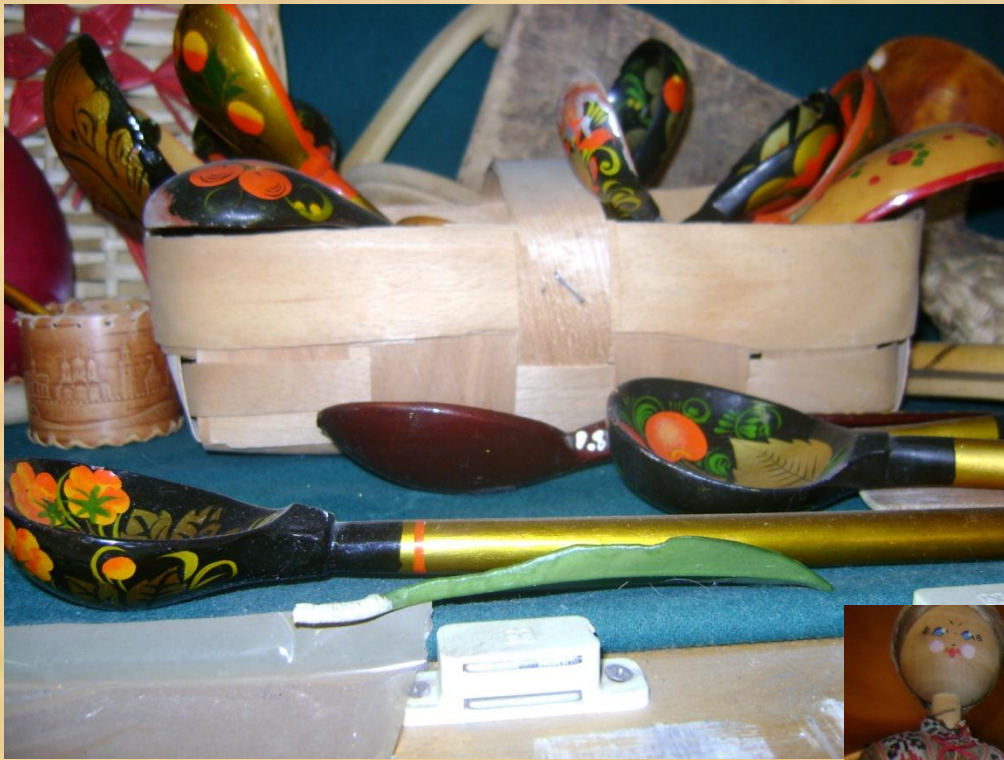
Предметы быта на Руси