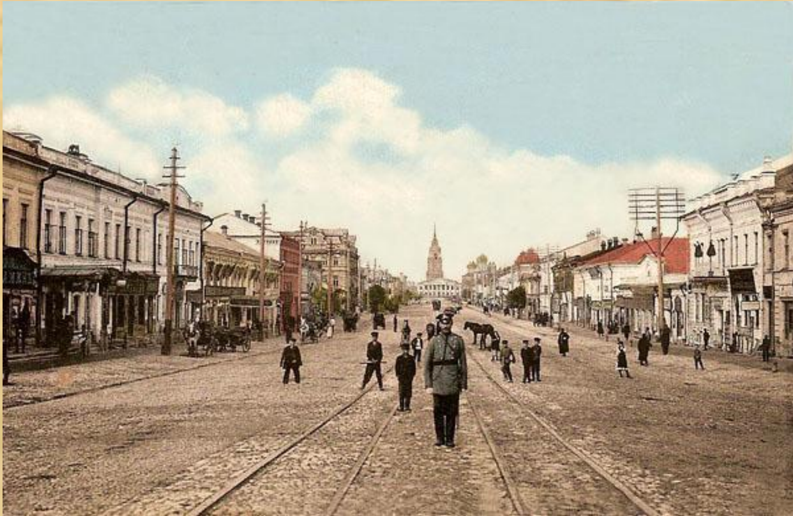
Площадь в русском городе первой половины XIX в.