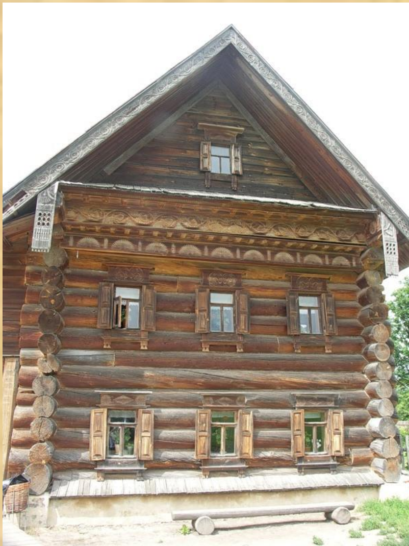
Дом зажиточного крестьянина