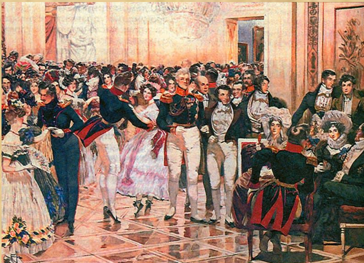
Бал в Москве 20-х гг. XIX в. С картины художника Д. Н. Кардовского