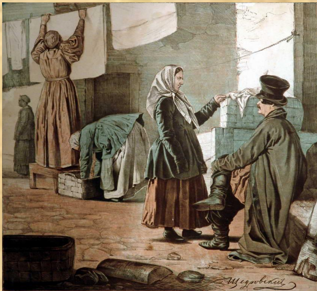
Прачки. С картины художника И. С. Щедровского