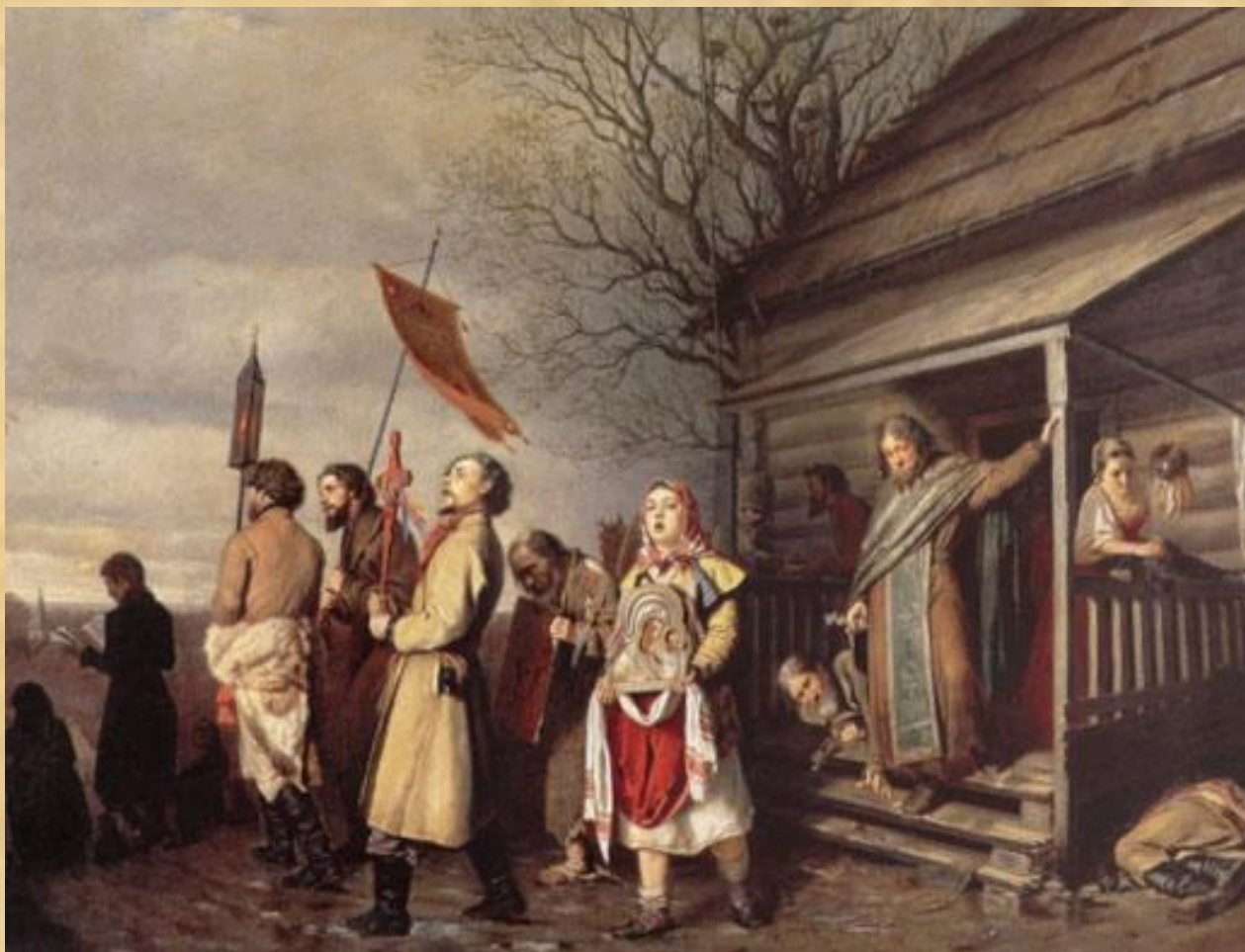
В. Г. Перов. Крестный ход на Пасху