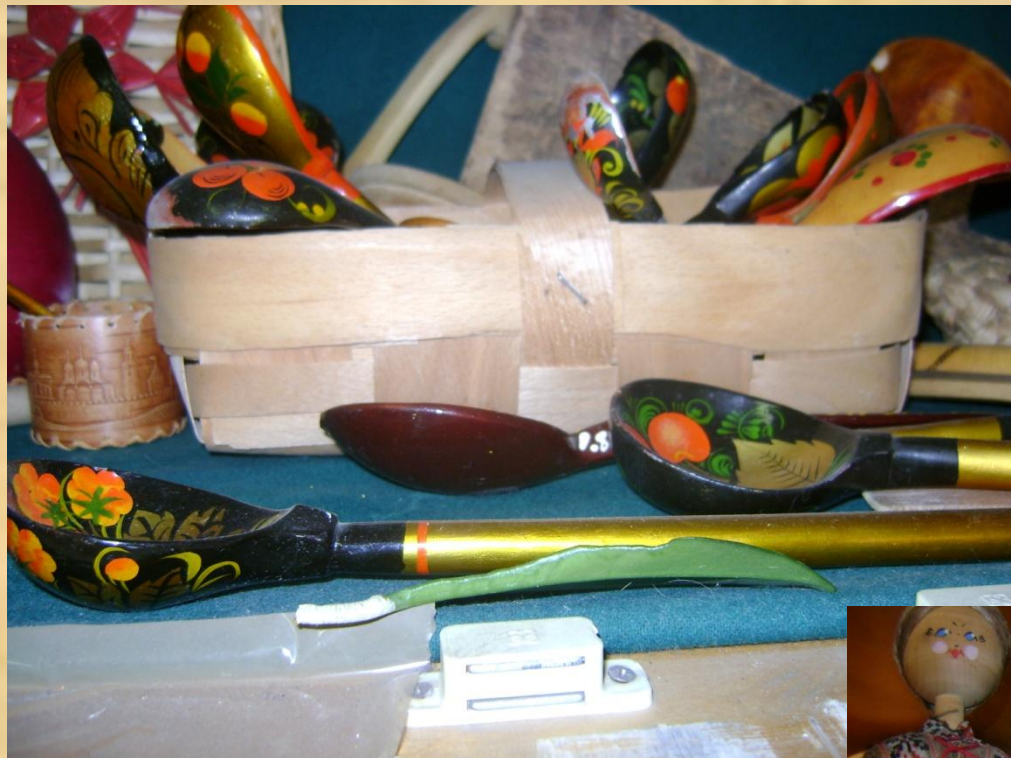
Предметы быта на Руси