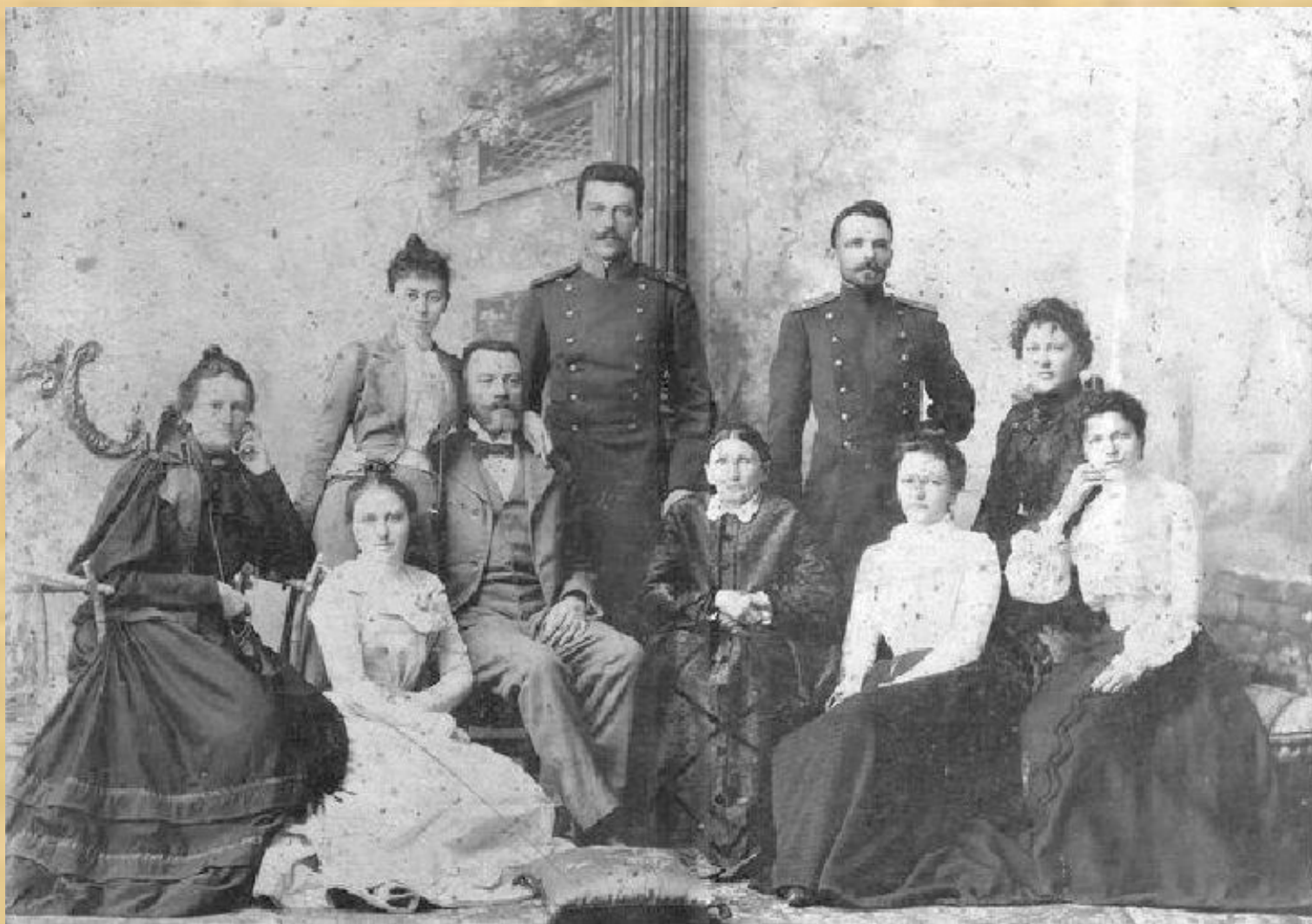
Обычная семья XIX века