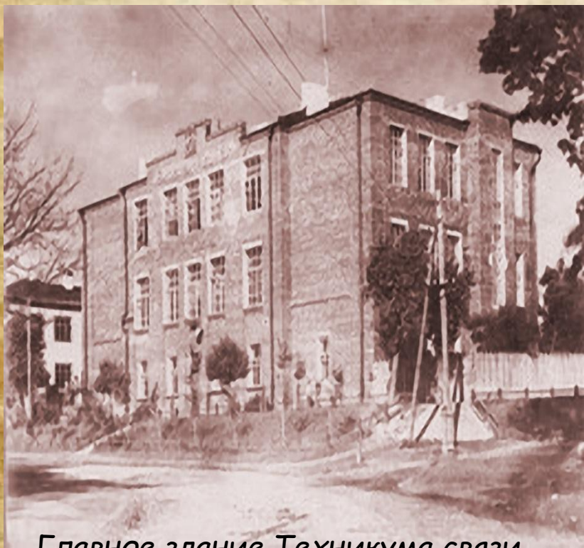
Главное здание Техникума связи до войны