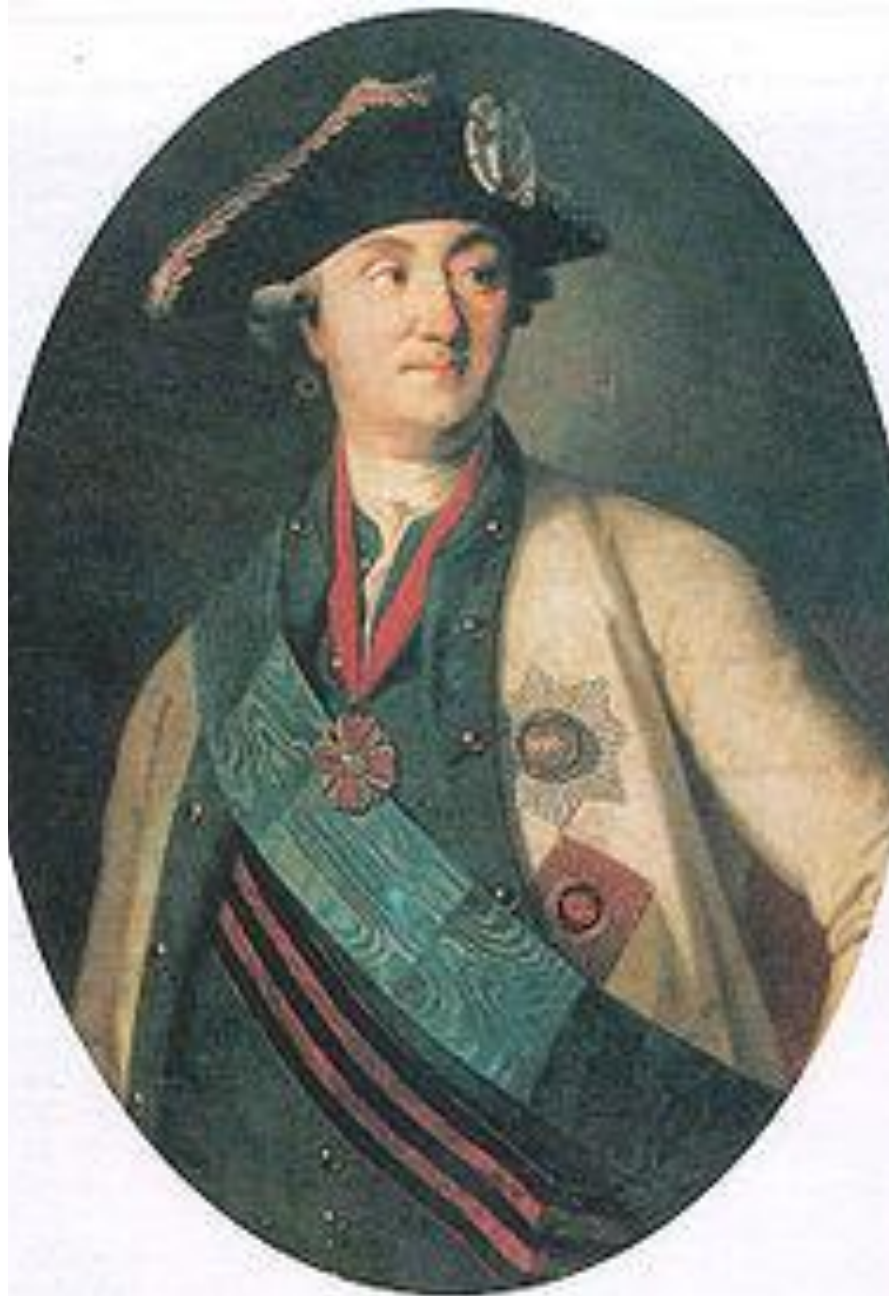
АЛЕКСЕЙ ГРИГОРЬЕВИЧ ОРЛОВ - ЧЕСМЕНСКИЙ