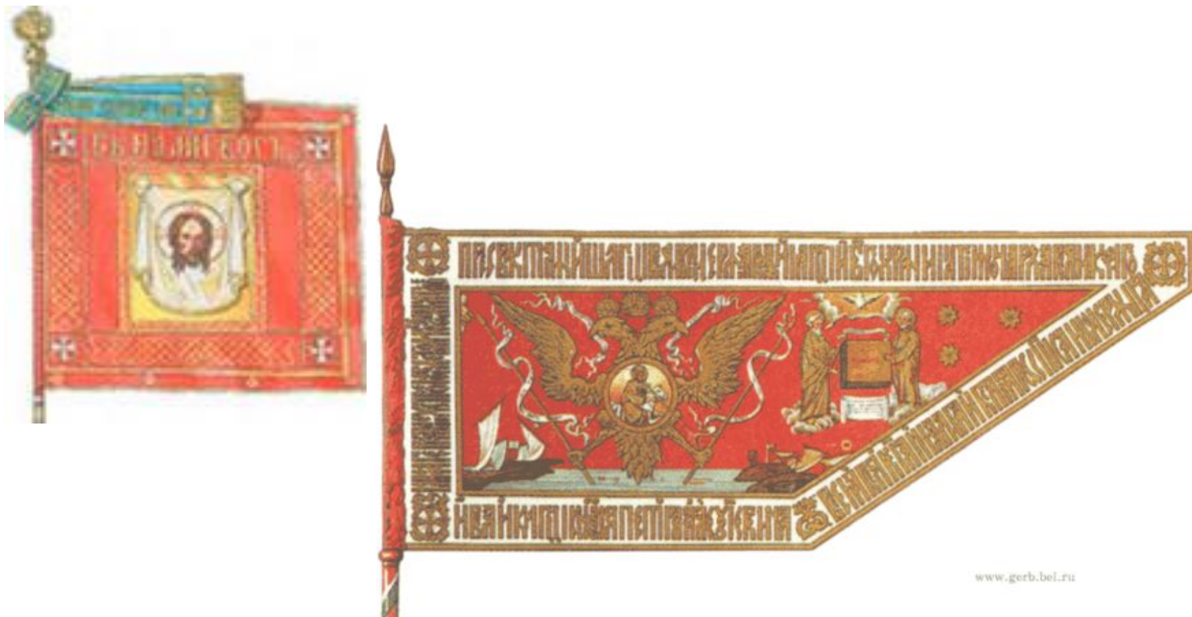
Гербовое знамя 1696 года