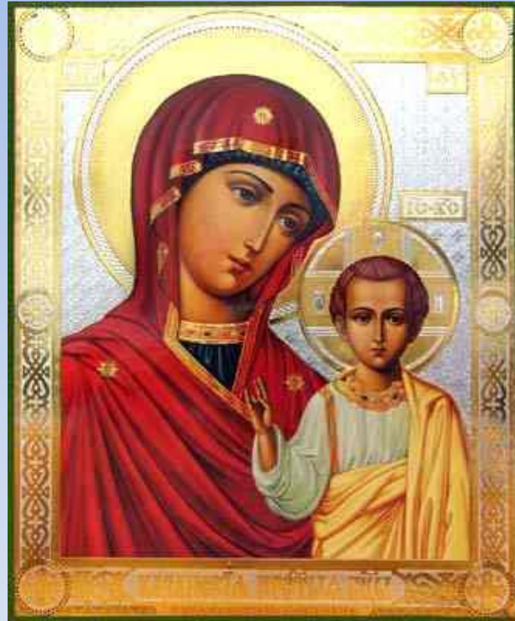
Владимирская икона Божией Матери Казанская икона Божией Матери