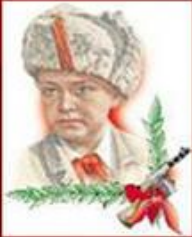
Лёня Голиков- герой Советского Союза

Когда фашисты заняли родную деревню Лёни, он ушел в партизаны. Лёня часто ходил в разведку, приносил сведения о расположении фашистских частей. 13 августа 1942 г. Лёня с партизанами отправился в разведку к партизаны уходили в лес, Лёня шел последним. В это время вдали показалась немецкая штабная машина. Машину подбросило. Из кабины выскочил гитлеровец с портфелем и побежал. Лёня бежал за ним, наконец, он сразил врага последним патроном. Это был немецкий генерал. Портфель с важными документами Лёня доставил в партизанский штаб. И они немедленно были отправлены в Москву. Из Москвы пришла радиogramма - предлагали представить к высшей награде всех участников операции по захвату важных документов. Но мальчику не удалось узнать о своем награждении. Он погиб 24 февраля 1943 г.