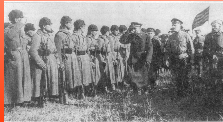
Адмирал Колчак на фронте. 1919. Admiral A.V. Kolchak during his visit to the front. 1919.