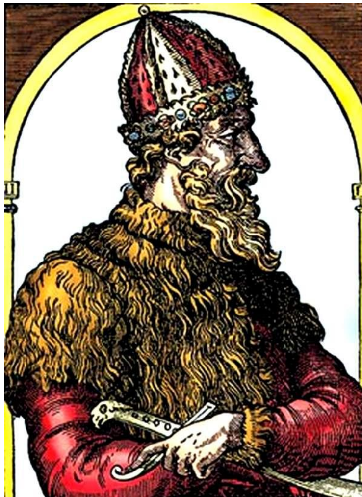
Иван III (1462 - 1505)