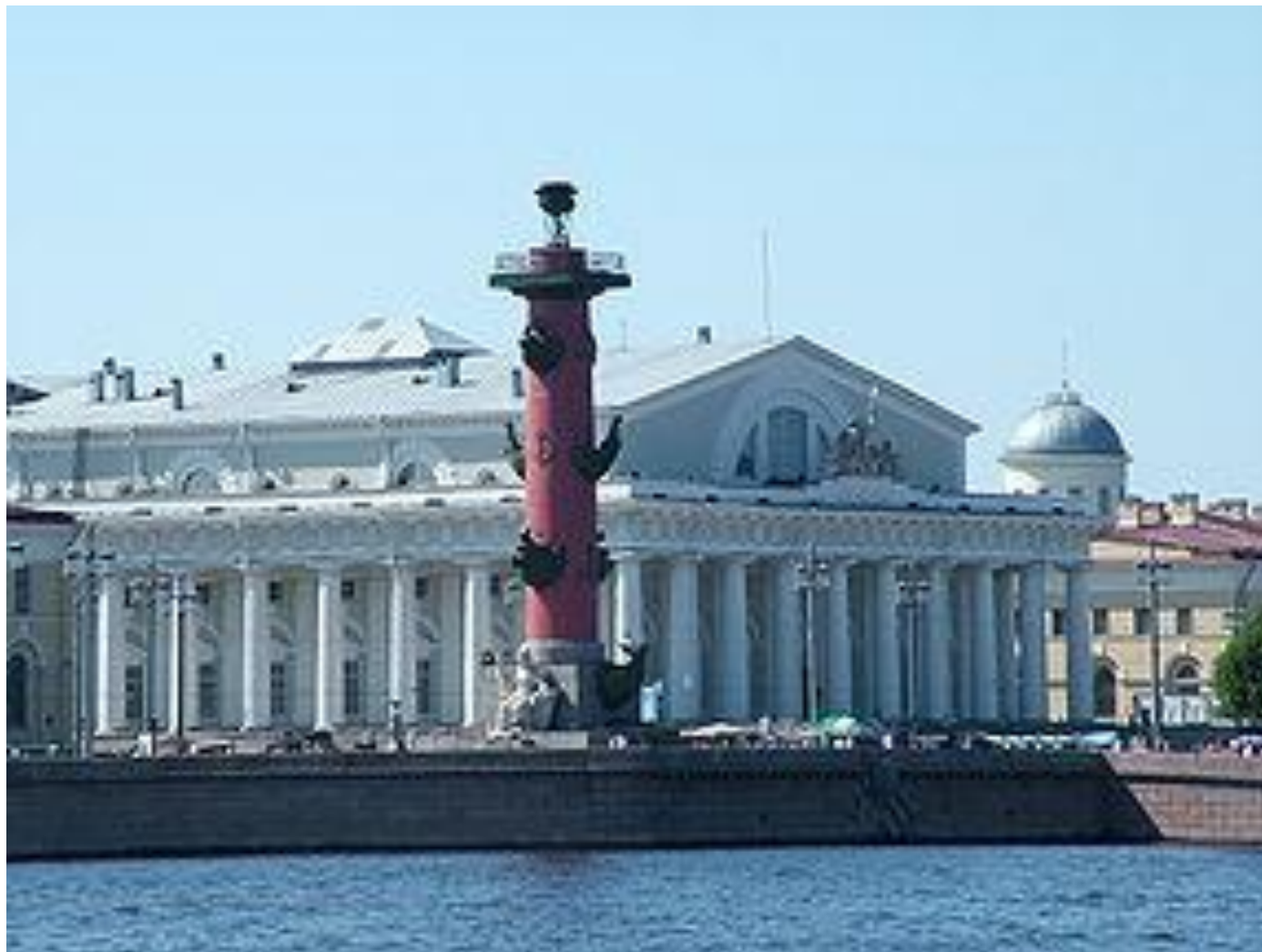
Ж.Ф. Тома де Томон Здание Биржи