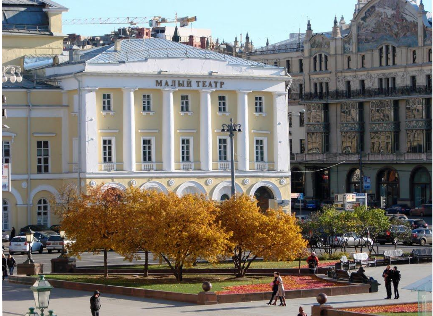
О.И. Бове Малый театр