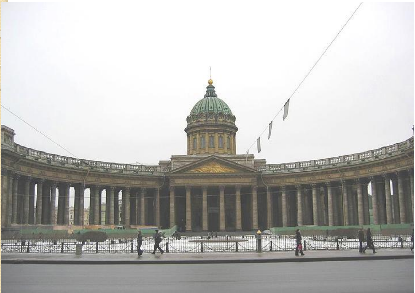
Казанский собор А. Н. Воронихин.