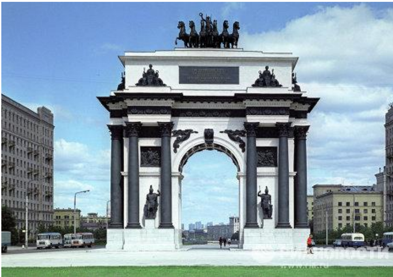
О.И. Бове Триумфальные ворота