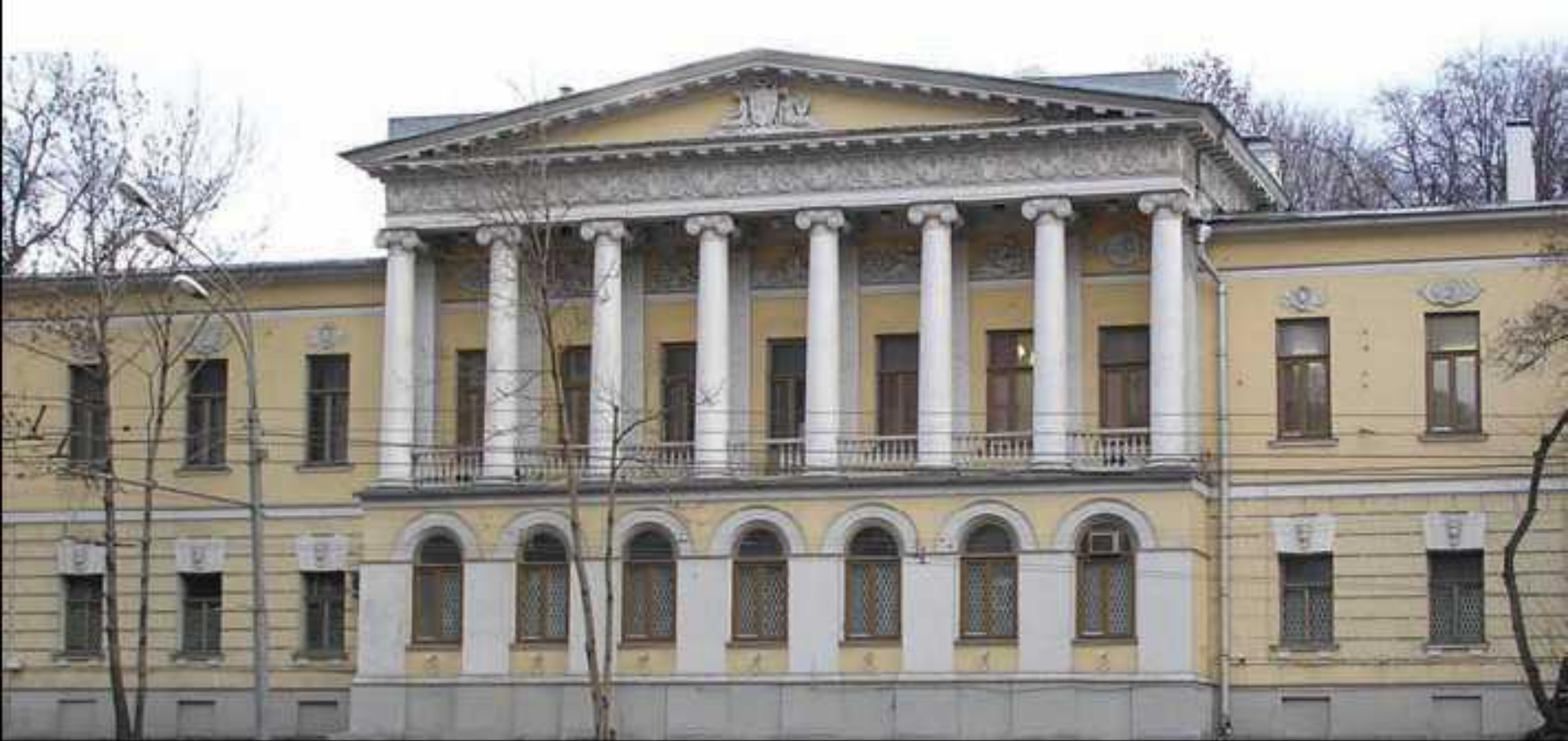
Д.И. Жиллярди Здание Университета