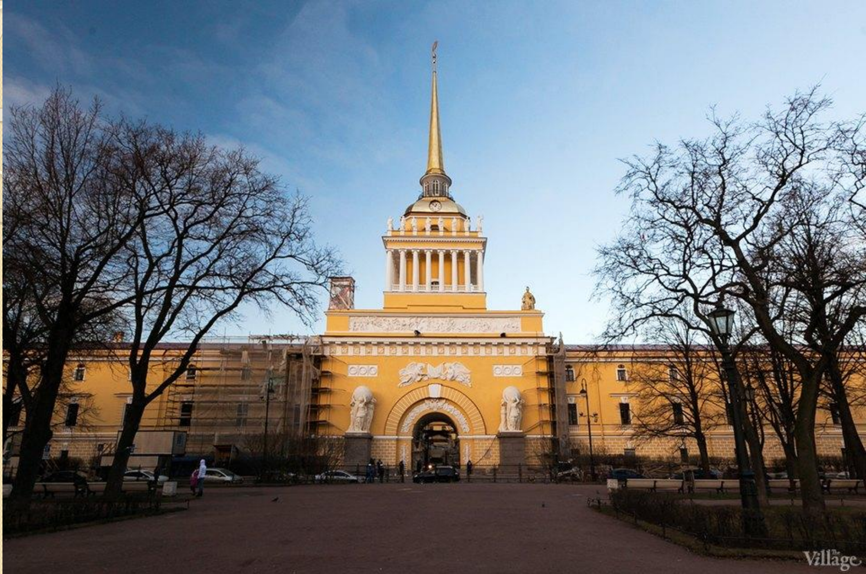
А.Д. Захаров Здание Адмиралтейства