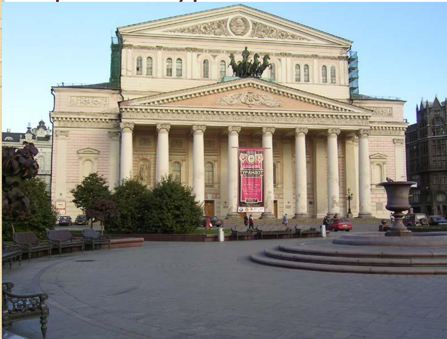
О.И. Бове Большой театр