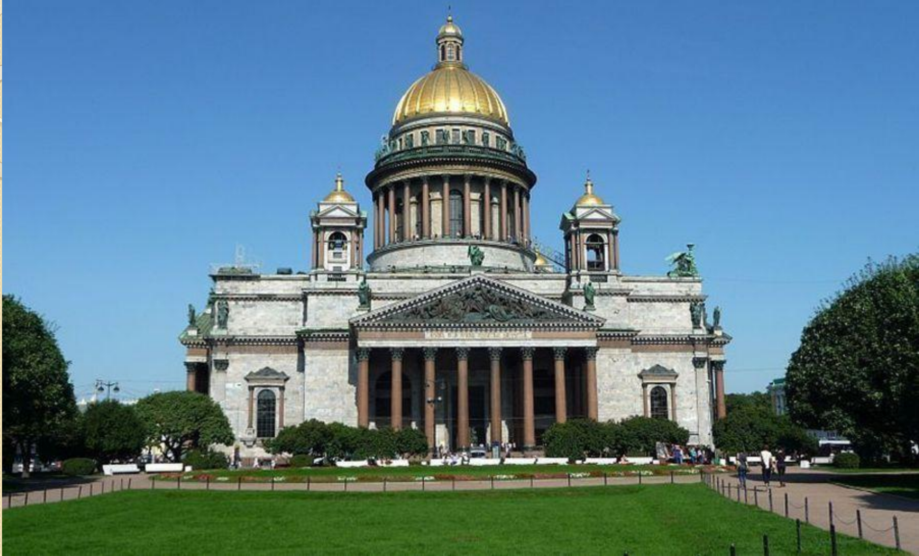
А.А. Монферран Исаакиевский собор