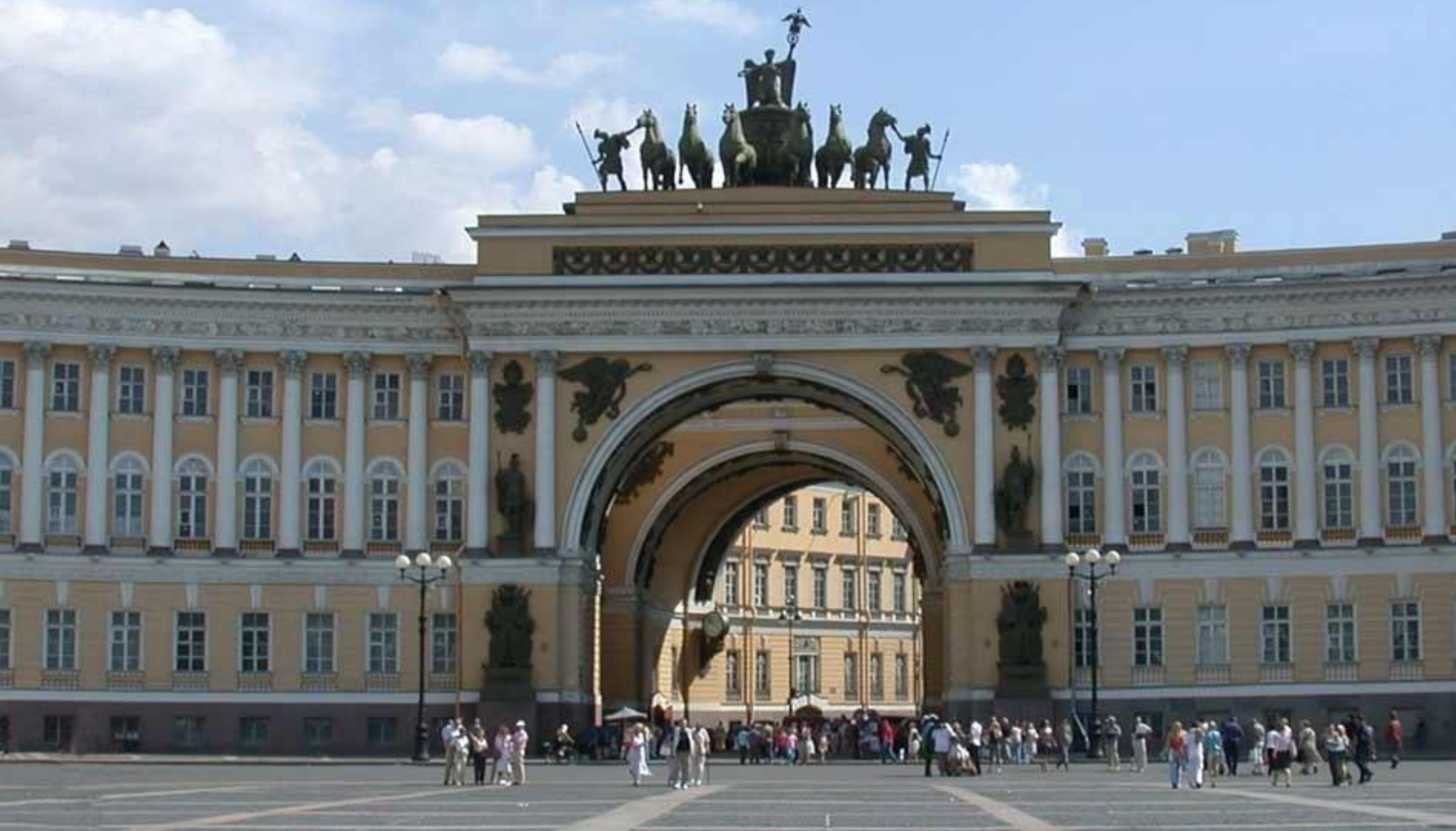
К. И. Росси Здания министерства и арка Главного штаба