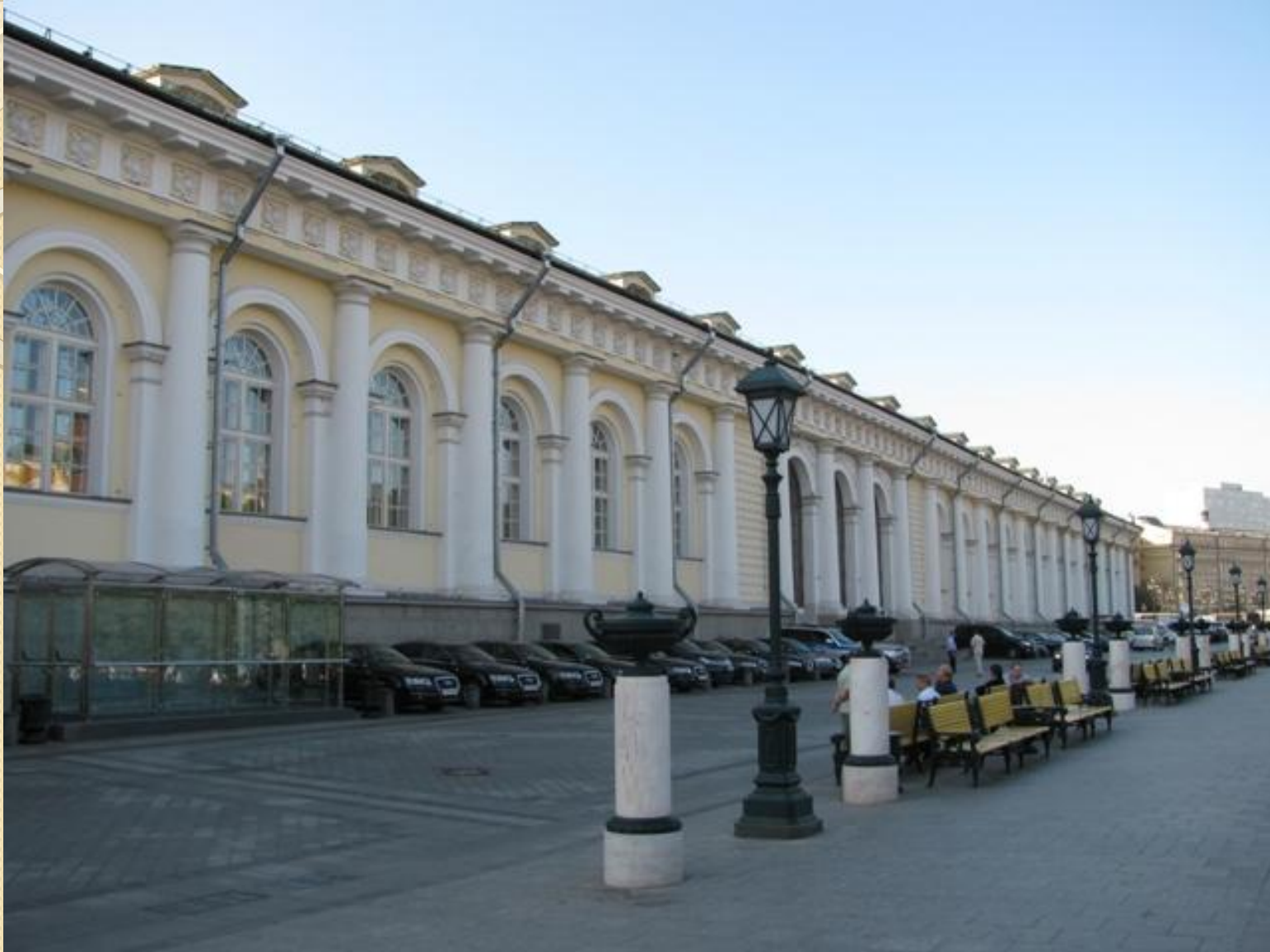
О.И. Бове Здание манежа