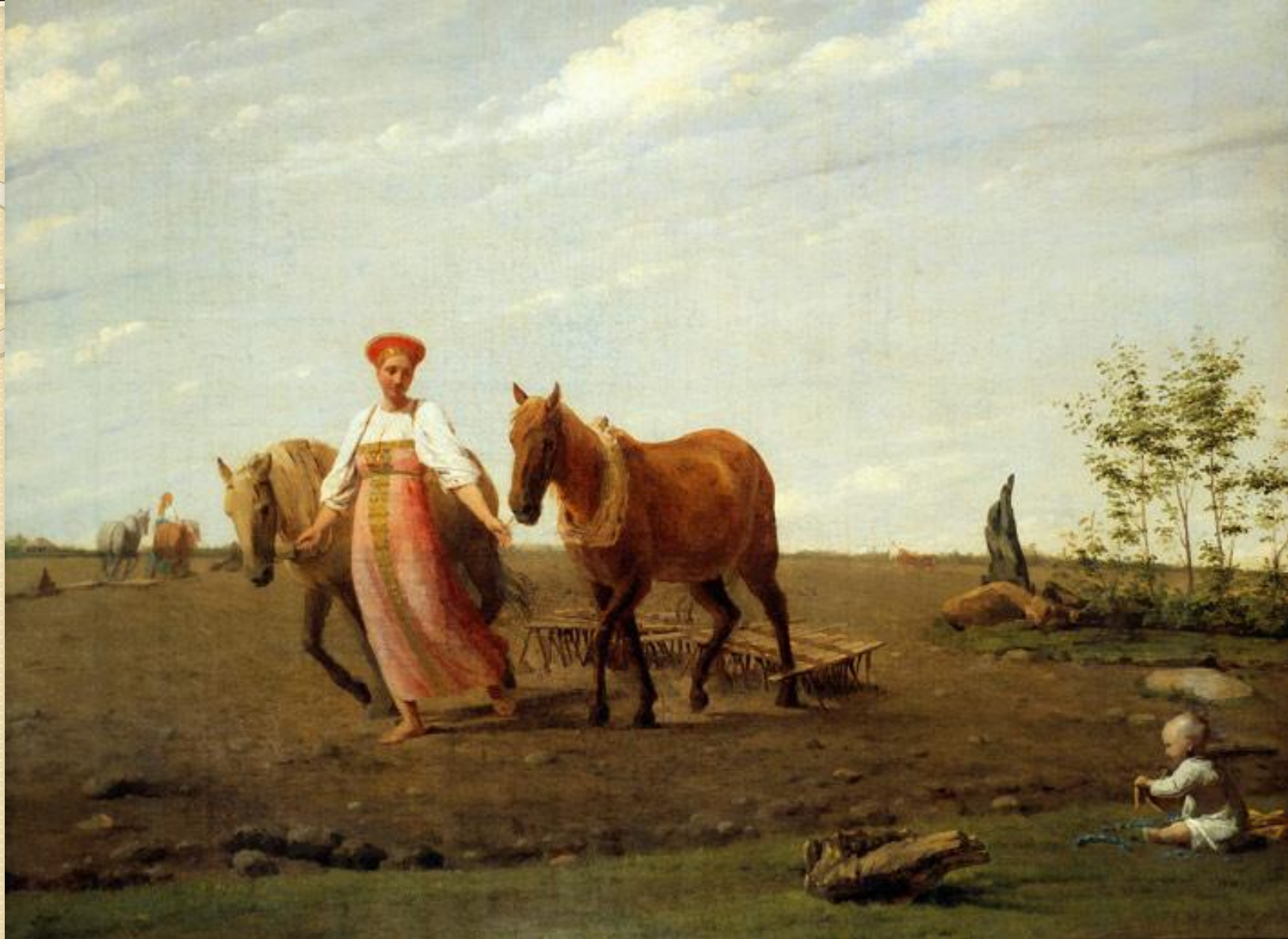
«На пашне. Весна» - Алексей Гаврилович Венецианов. Первая половина 1820-х.