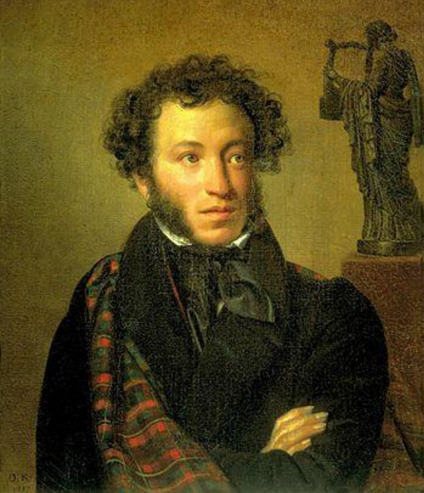
Орест Адамович Кипренский (1782-1836гг) Портрет А. С. Пушкина. 1827 г.