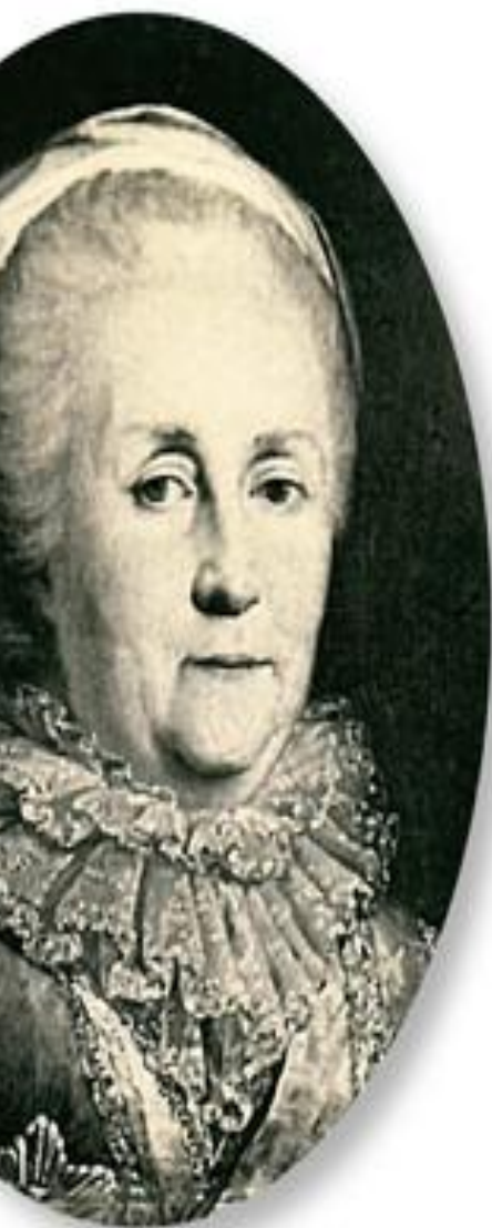
Императрица Екатерина II