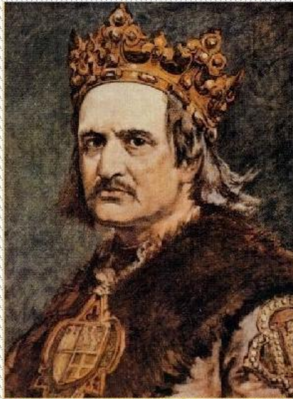
Ягайло – князь Литовский