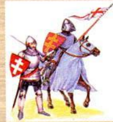
Воины Литовского княжества