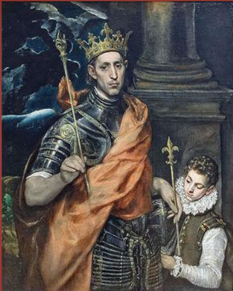
Людовик IX Святой