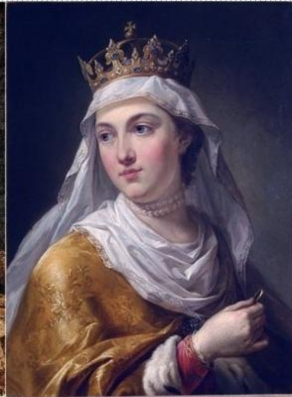
Ядвига – польская принцесса