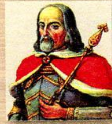
Князь ВКЛ Витовт