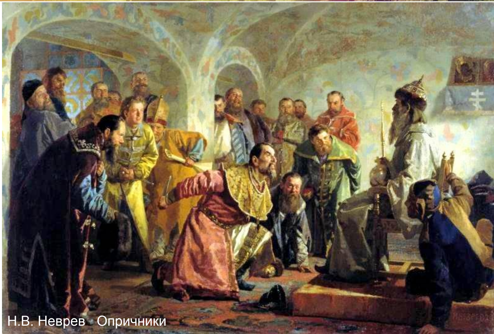
Н.В. Неврев. Опричники

Грозный набрал особое опричное войско, состоявшее сначала из 1000 а потом из 6000 человек. Каждый опричник приносил клятву на верность царю и обязывался не общаться с земскими.