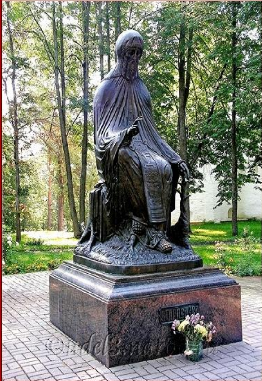
Фото памятника при. Савве Сторожевскому у входа в Саввино- Сторожевский монастырь, фото сделано в июле 2010 года