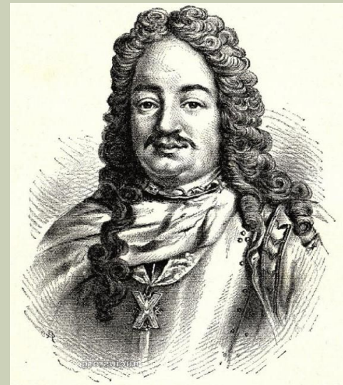
Франц Лефорт - ближайший помощник и советник Петра I; сыграл крупную роль в создании новой царской армии, возглавил Азовские походы