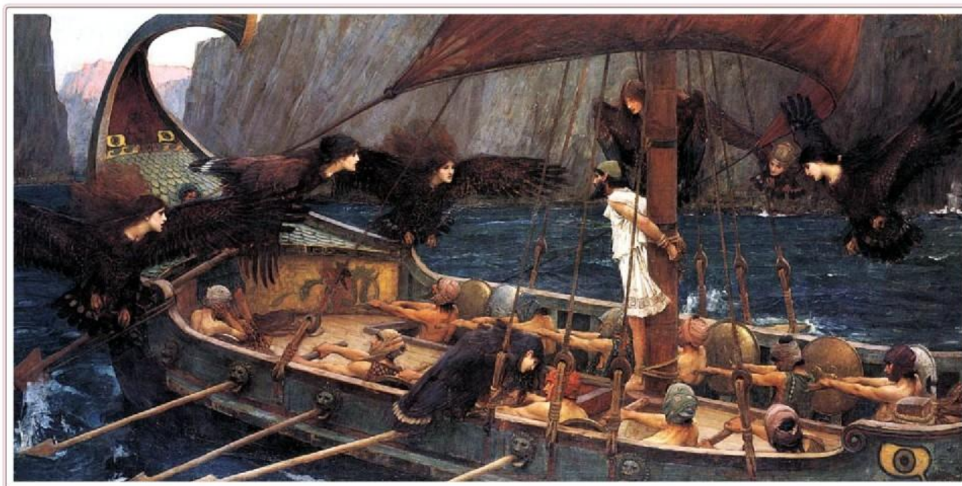
Одиссей и Сирены. Художник Дж. Вильям Уотерхоус, 1891 г.