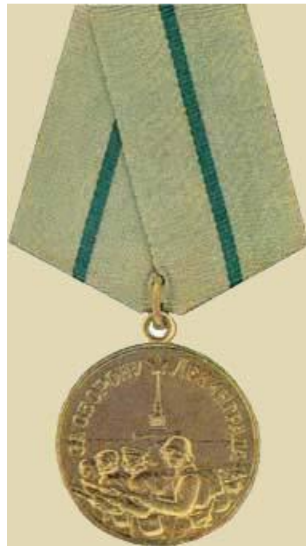
Медаль за оборону Ленинграда

Медалью награждено около 1 миллиона 470 тысяч человек. Среди них 15 тысяч