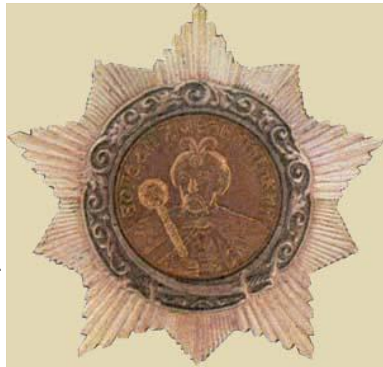
Орден Богдана Хмельницкого

Орден мог получить командующий фронтом или армией за успешную, с применением умелого маневра операцию, в результате которой освобожден от врага город или район, причем неприятелю