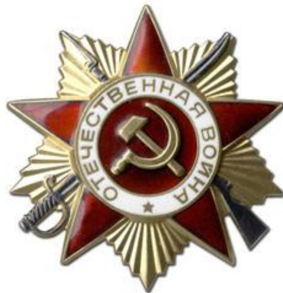
Орден Отечественной войны

военнослужащие любых родов войск, включая бойцов и командиров