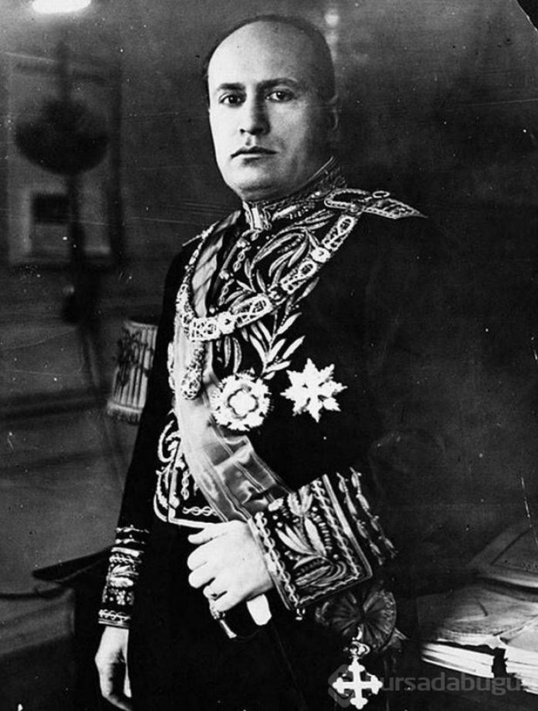
Бенито Муссолини (1883-1945 гг.) дуче