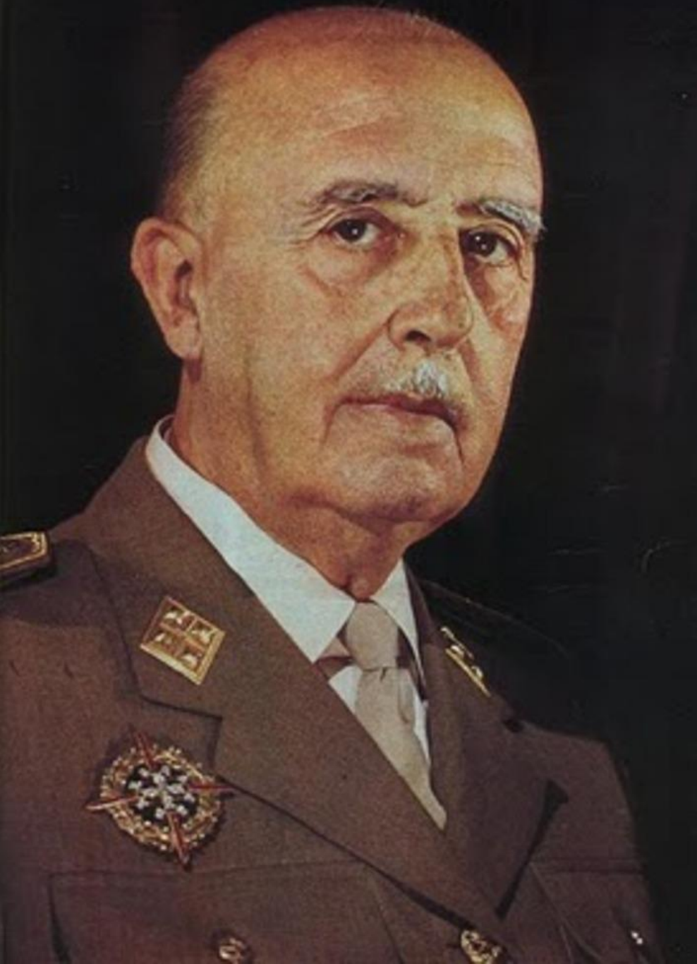
Франсиско Франко (1892-1975 гг.)