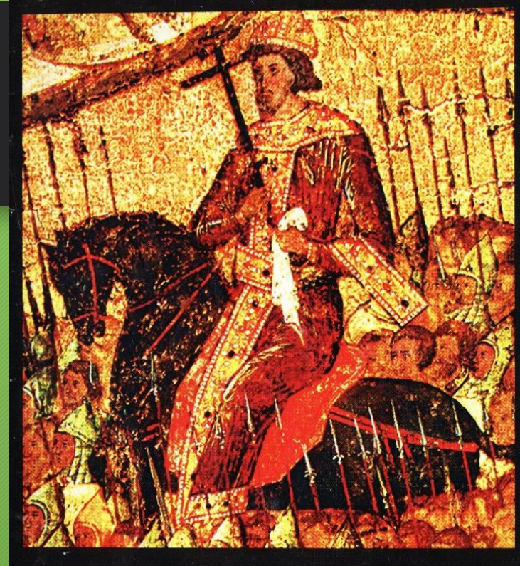
Вождь Земной Воинствующей Церкви. Святой Благоверный Царь-Помазанник Божий

Замысел этого произведения очевиден - истолковать военный успех как результат покровительства небесных сил, а подвиг русских воинов — как победу православия над «неверными басурманами».