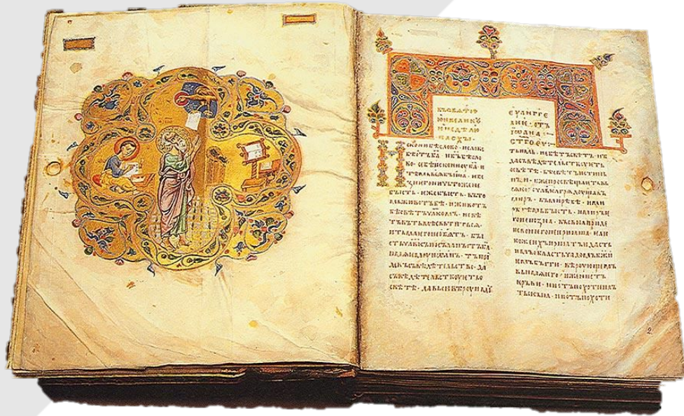
Остромирово Евангелие 1056-1057 г.