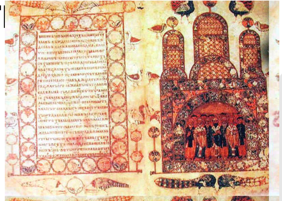
Изборник Святослава 1073 г.