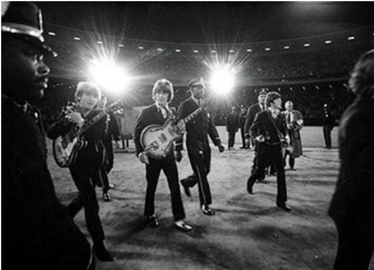
Битлз на концерте