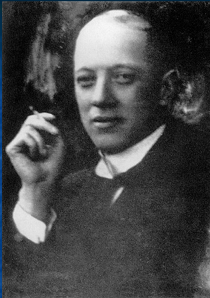
Н. С. Гумилев