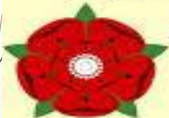
Алая роза Ланкастеров

Женившись на племяннице Ричарда III Елизвете Йоркской, Генрих VII заявил об объединении ранее враждовавших домов Йорков и Ланкастеров.