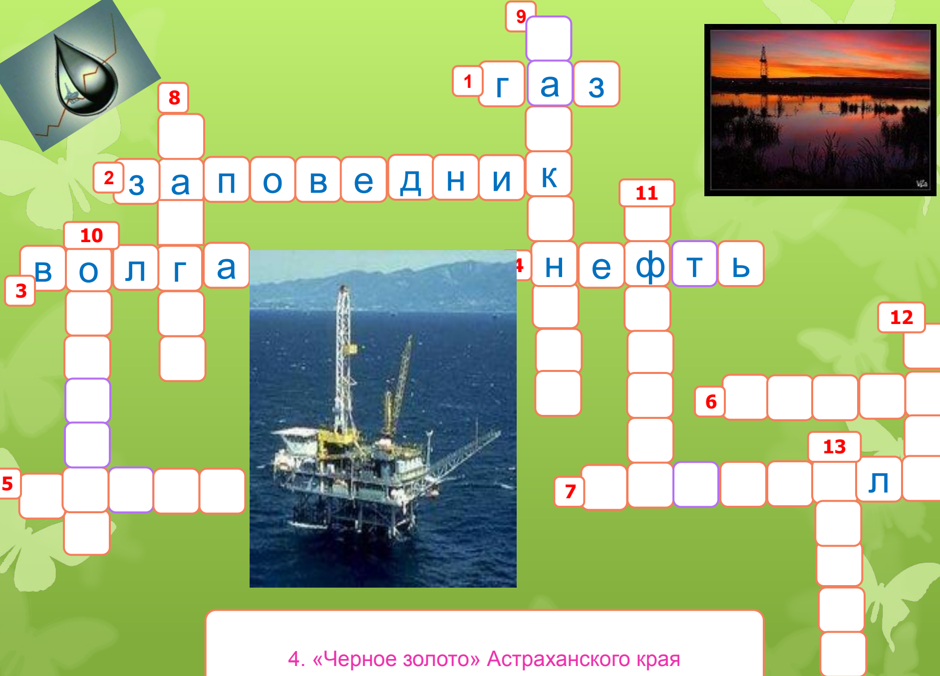
4. «Черное золото» Астраханского края