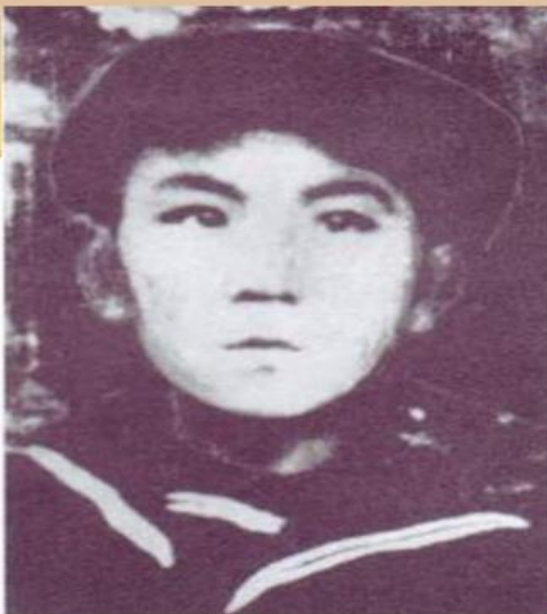
Первое фото Д.Кугультинова. 1928 год.