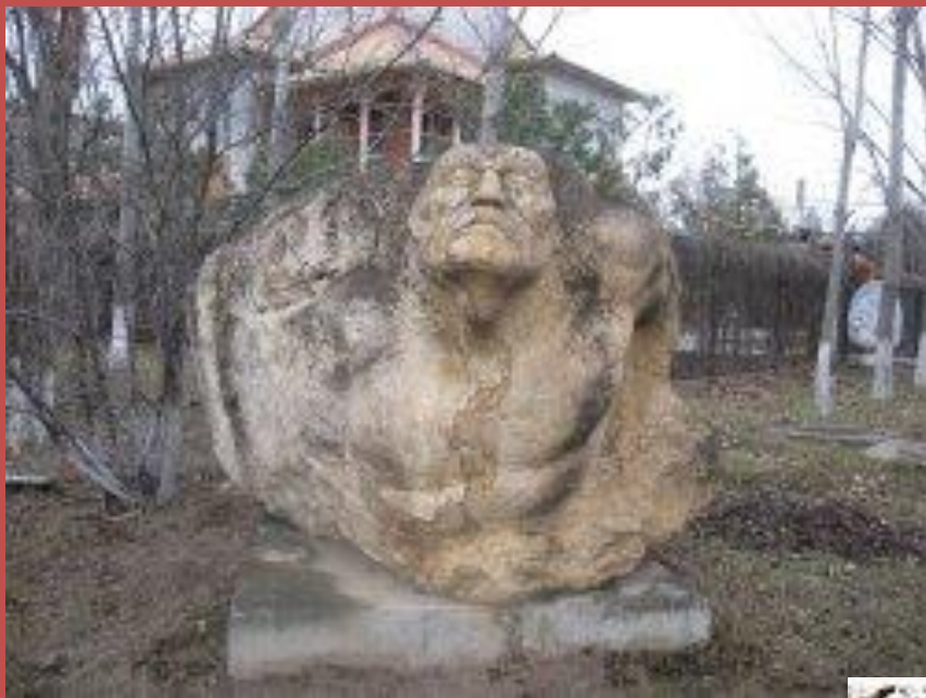
Дом-музей поэта Д.Н.Кугультинова