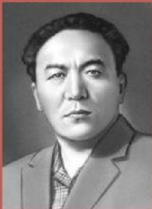
Давид Кугультинов в молодости

Давид Никитич Кугультинов родился 13 марта 1922 года в селении Абганер Гаханкин (ныне Эсто-Алтай Яшалтинского района в Республике Калмыкия).