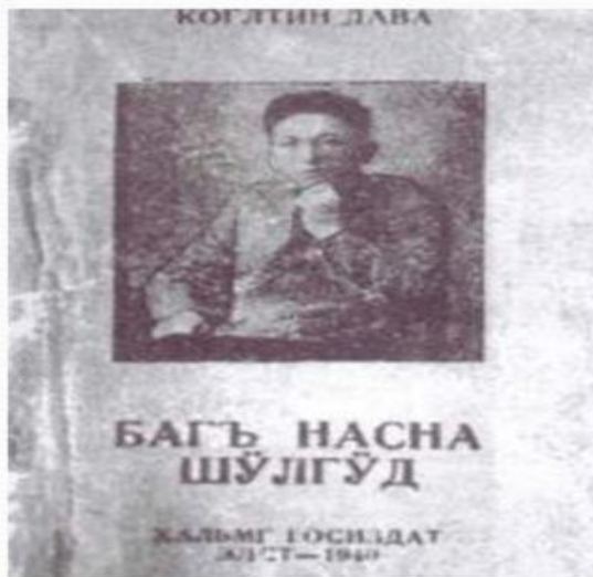
Первое издание стихотворений Д.Н.Кугультинова . Элиста 1940 год.

Еще в раннем детстве Давид Кугультинов определил свое жизненное кредо, начав писать стихи. Бог даровал ему судьбу поэта. «Не помню, - признавался поэт, - когда я начал писать стихи, но первое стихотворение напечатал в двенадцать лет в многотиражной газете. Стихотворение имело длинное название «Успешно проведем отелочную кампанию».