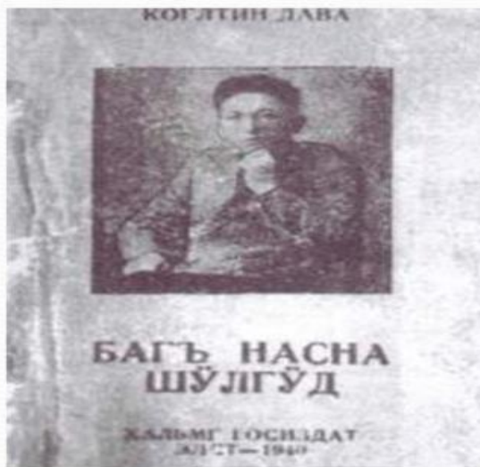
Первое издание стихотворений Д.Н.Кугультинова . Элиста 1940 год.

Еще в раннем детстве Давид Кугультинов определил свое жизненное кредо, начав писать стихи. Бог даровал ему судьбу поэта. «Не помню, - признавался поэт, - когда я начал писать стихи, но первое стихотворение напечатал в двенадцать лет в многотиражной газете. Стихотворение имело длинное название «Успешно проведем отелочную кампанию».