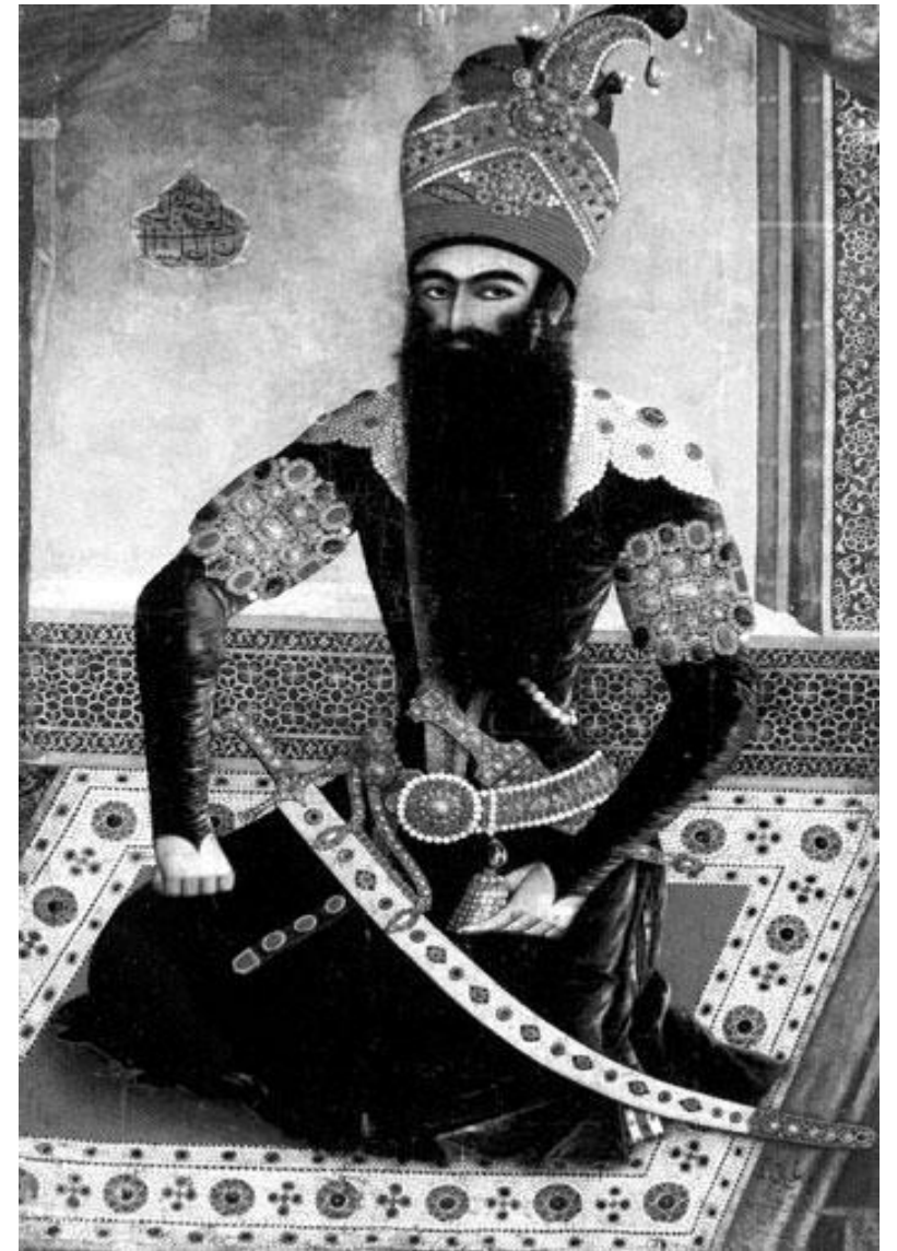
Аббас I Великий – персидский шах

1594 г. - беспошлинная торговля между Россией и Персией. Выгодный союз против Османской империи. Успешное развитие отношений между Россией и Персией.