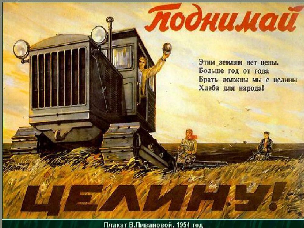
Плакат В.Ливановой. 1954 год