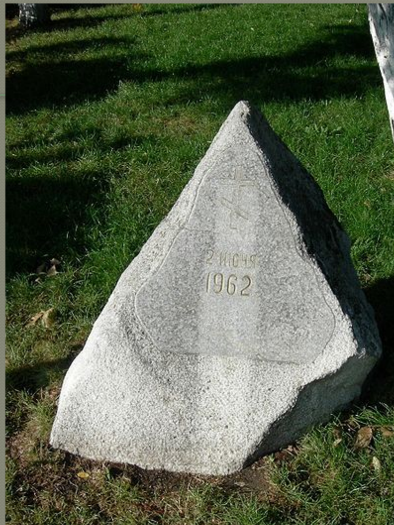
Камень-на-Крови, установленный на месте трагедии в Новочеркасске.