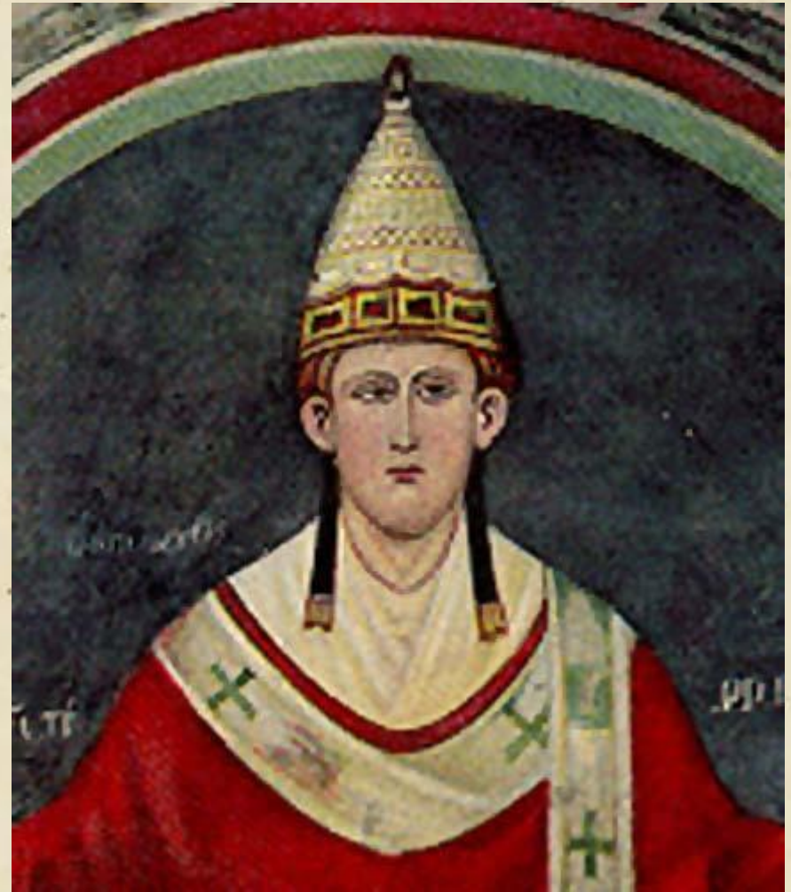
Иннокентий III (1198-1216)