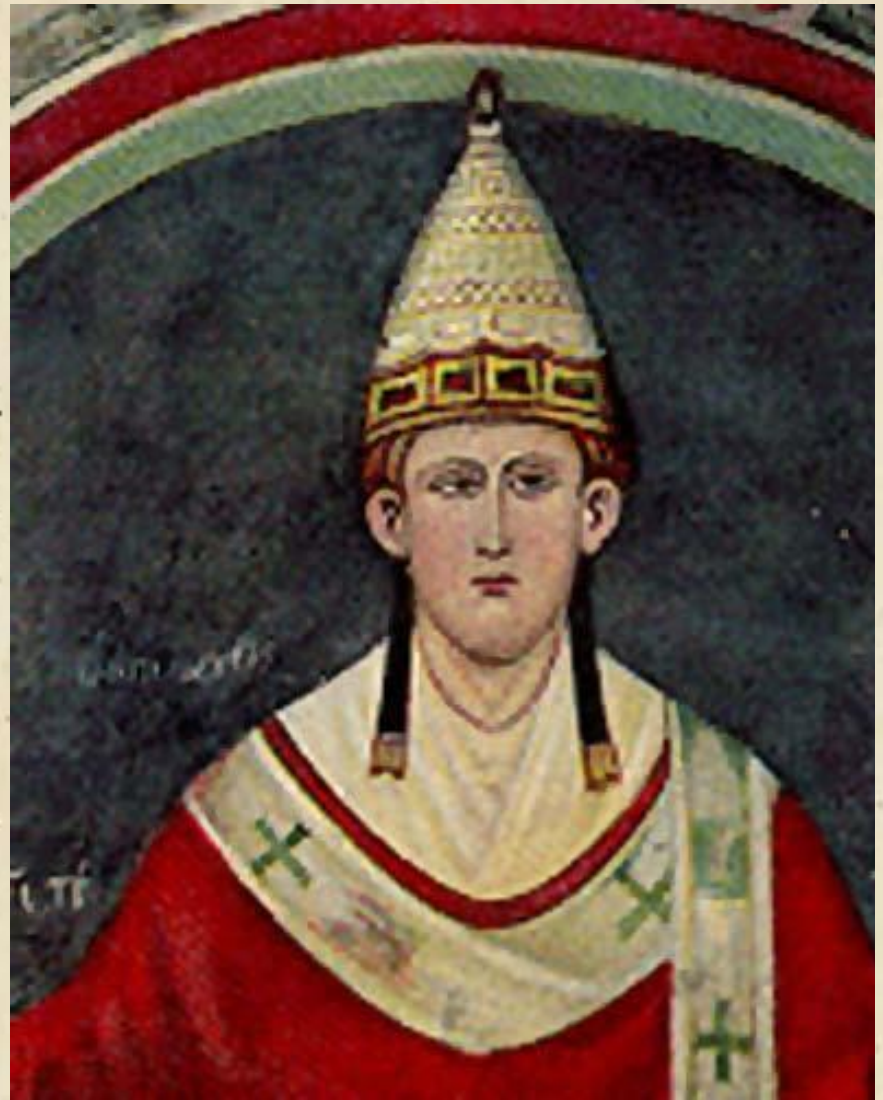
Иннокентий III (1198-1216)