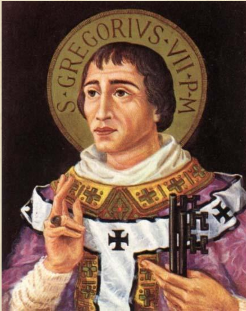
Григорий VII (1073-1085)

Какими средствами папы укрепляли свое влияние?