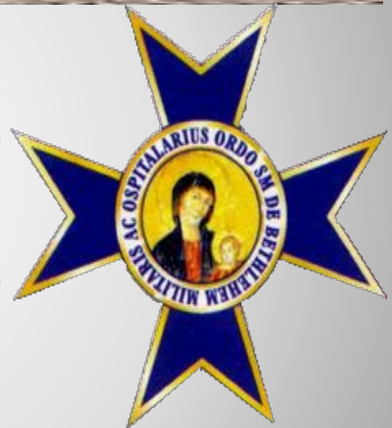
Орден Святой Марии Вифлеемской