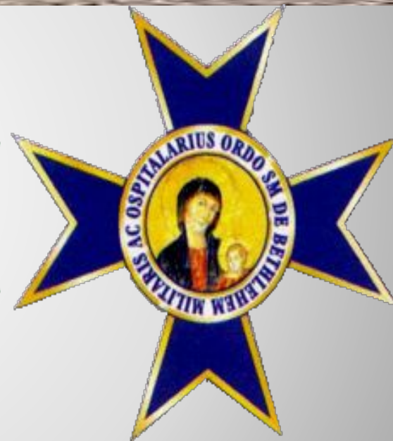
Орден Святой Марии Вифлеемской