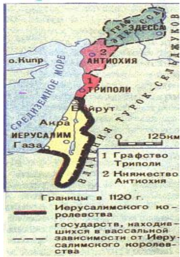
Государства, основанные крестоносцами

Были созданы Антиохийское княжество, Эдесское графство, Иерусалимское королевство.