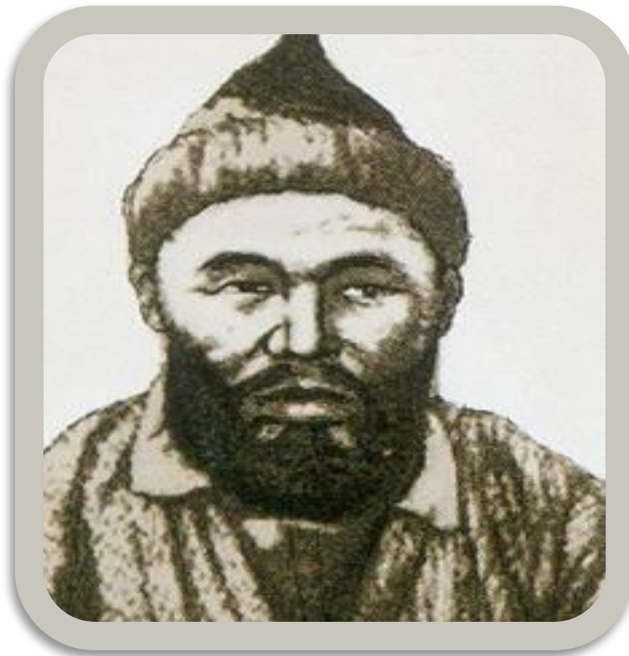
Есет Көтібарұлы (1803-1888)