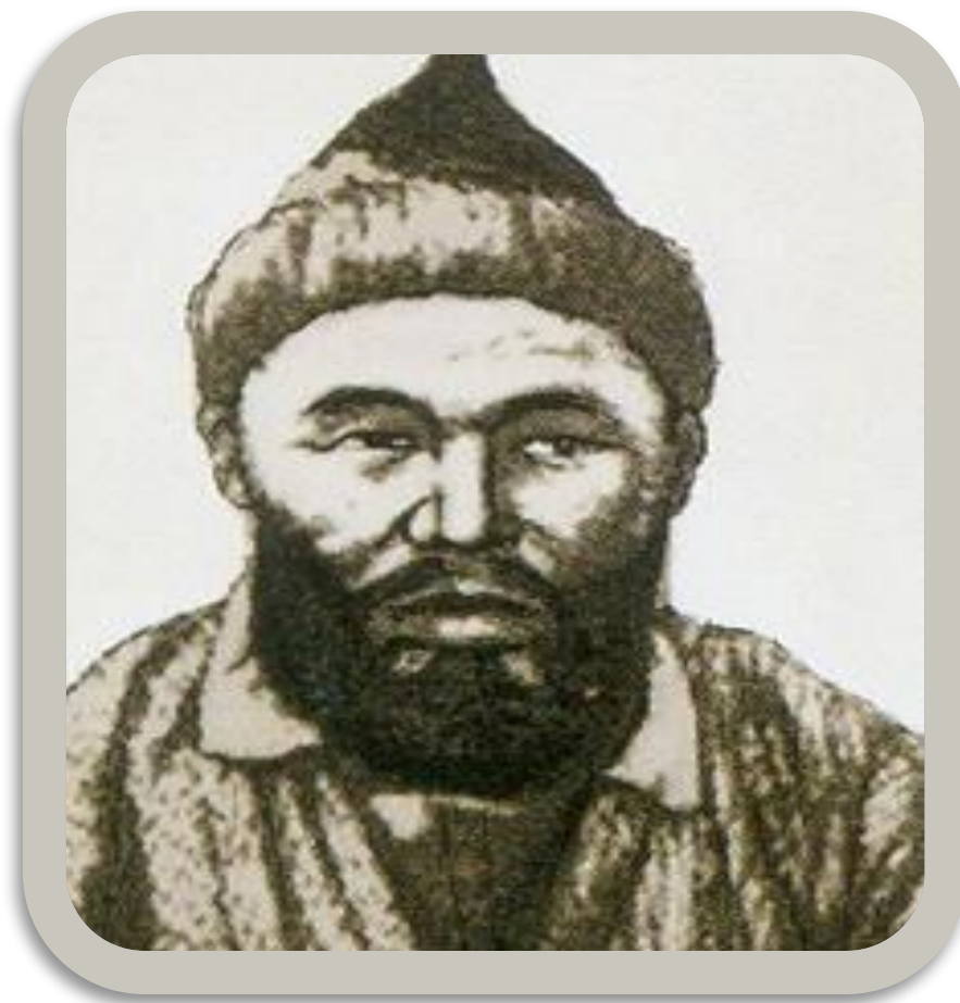
Есет Көтібарұлы (1803-1888)