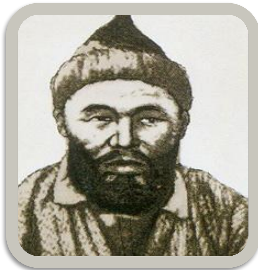
Есет Көтібарұлы (1803-1888)