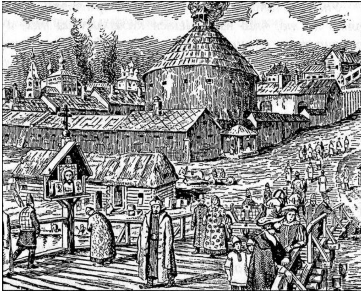
Московский Пушечный двор