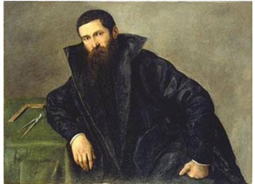
Воображаемый портрет кисти Лотто