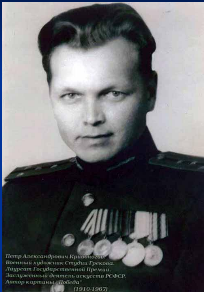
Петр Александрович Кривоногов. Военный художник Студии Грекова. Лауреат Государственной Премии. Заслуженный деятель искусств РСФСР. Автор картины "Победа"