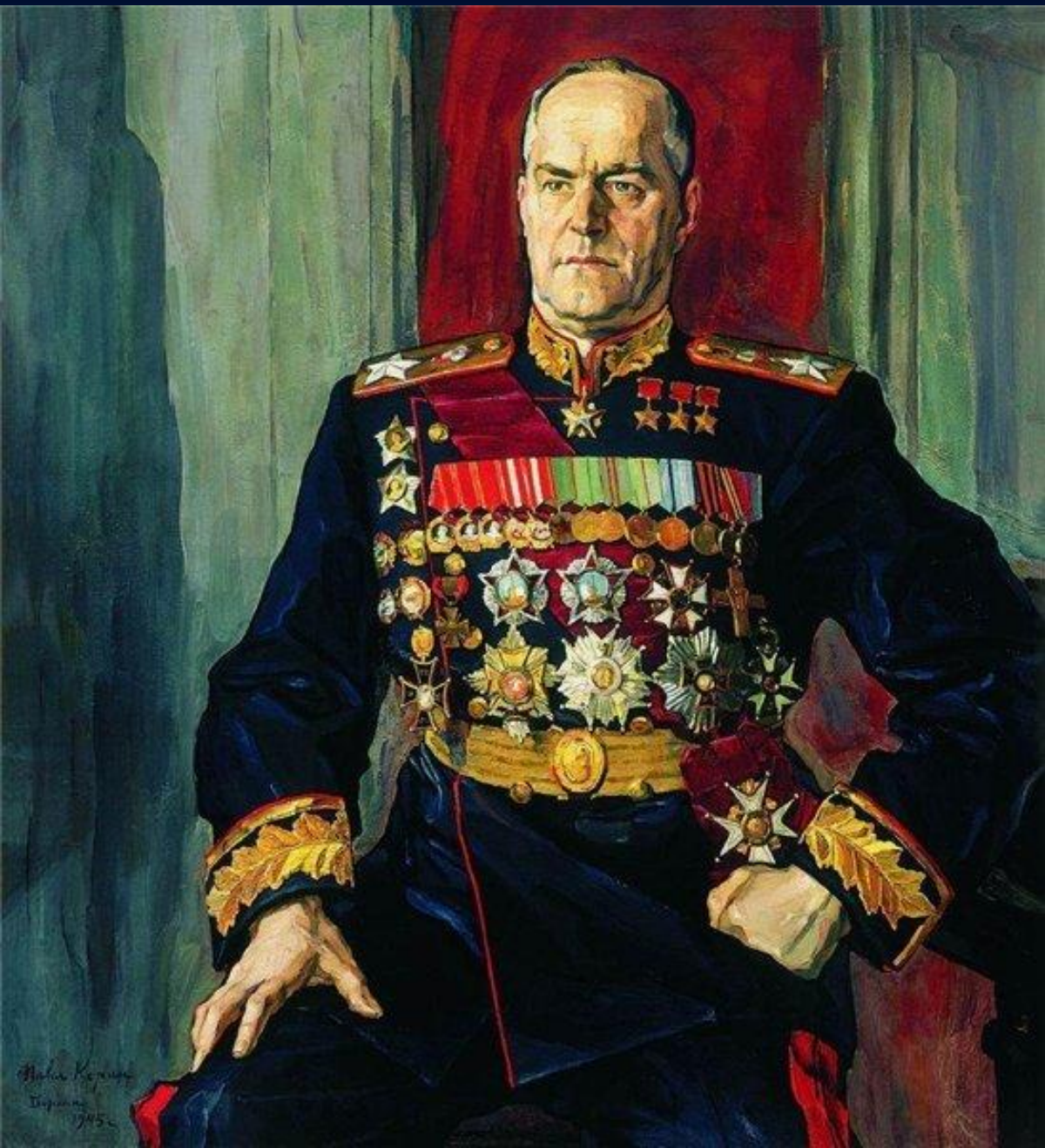
П.Д. Корин «Портрет маршала Г.К. Жукова»