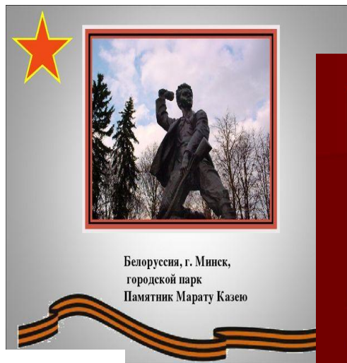
Белоруссия, г. Минск, городской парк Памятник Марату Казею

Юные безумные герои, Юными остались вы навеки. Перед вашим вдруг ожившим строем Мы стоим, не поднимая век. Боль и гнев сейчас тому причиной, Благодарность вечная вам всем, Маленькие стойкие мужчины, Девочки, достойные поэм.