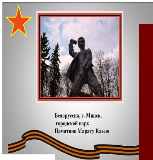
Белоруссия, г. Минск, городской парк Памятник Марату Казею

Юные безумные герои, Юными остались вы навек. Перед вашим вдруг ожившим строем Мы стоим, не поднимая век. Боль и гнев сейчас тому причиной, Благодарность вечная вам всем, Маленькие стойкие мужчины, Девочки, достойные поэм.